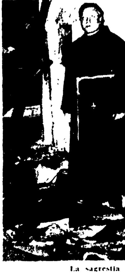
La sacrestia dopo l'incendio

I danni ammontano a 4 milioni - Perduti anche un affresco, pregevoli arredi e reliquie