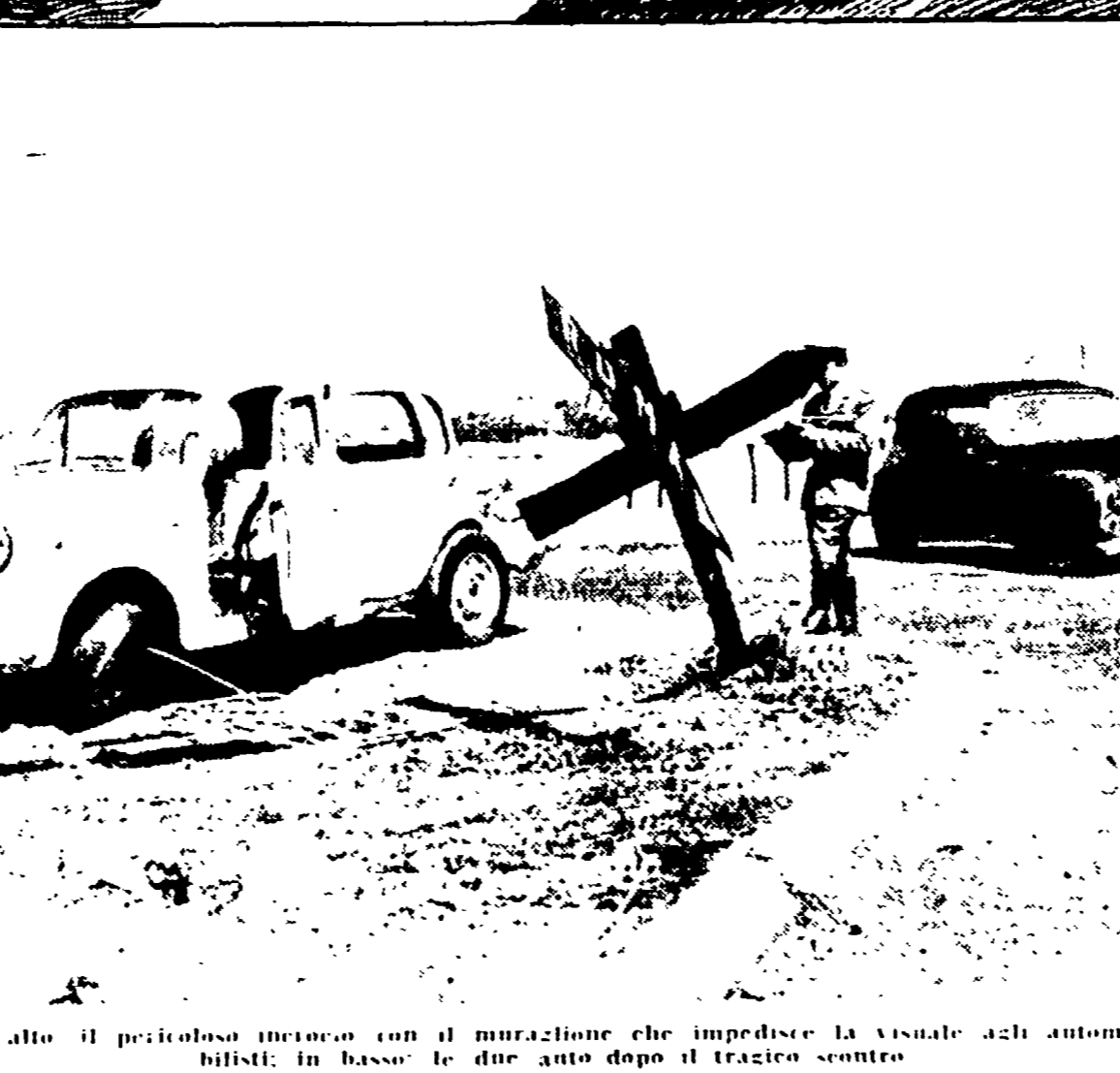
In alto il pericoloso incrocio con il muraglione che impedisce la visuale agli automobilisti. In basso: le due auto dopo il tragico scontro.

Una ragazza è morta e cinque persone sono rimaste ferite e una gravissima selaggina della strada, causata da un grosso muraglione che impedisce la visuale alle auto che percorrono l'Ostiense, all'incrocio con il raccordo anulare. Una Mercedes - proveniente da Ostia e condotta da un turista austriaco - ha urtato un'auto di un'autostrada che stava sorpassando un'auto di un'autostrada. Lo scontro, nonostante la disperata frenata delle due auto, è stato così inevitabile e violentissimo.