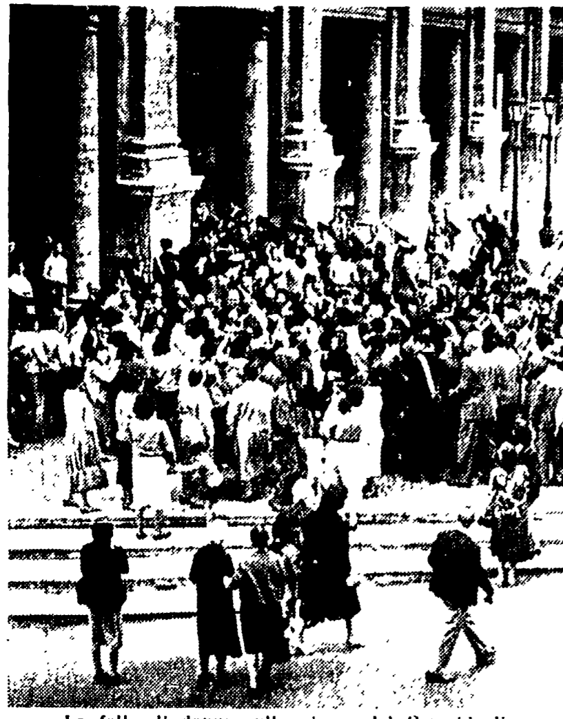
La folla di donne sulla piazza del Campidoglio

L'annuscupio problema della mancanza di alloggi popolari a fitto modesto, accessibile alla parte meno abbiente della popolazione, è nuovamente esplosa ieri mattina. Centinaia di donne, provenienti dalle zone della città nelle quali sussistono popolosi agglomerati di baracche - che il comune definisce con simpatia enfimistica come "gruppi" - e si sono riunite al cinema "Colosseo" dando vita ad una combattiva assemblea, durante la quale sono state proposte al sindaco comunista e governativo una serie di iniziative per combattere una situazione inaccettabile che le varie Giunte comunali hanno sempre ignorato. L'assemblea, all'incirca di 500 persone, ha approvato una serie di iniziative per combattere una situazione inaccettabile che le varie Giunte comunali hanno sempre ignorato.