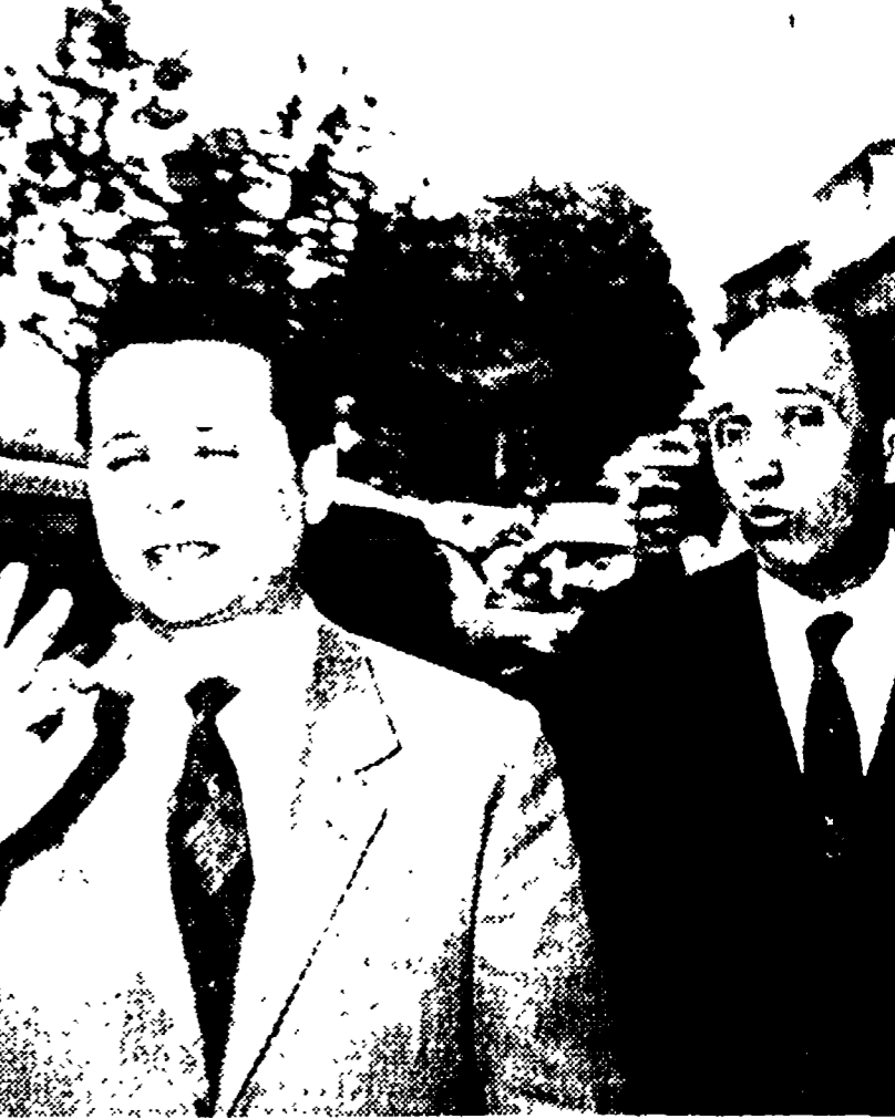
I due funzionari della « Sureté »

Di giovedì 11 maggio ha avuto luogo la gara di diffusione dell'Unità. Il gruppo comunista ha vinto la gara, con un risultato di 14.000 copie. Il gruppo comunista ha vinto la gara, con un risultato di 14.000 copie.