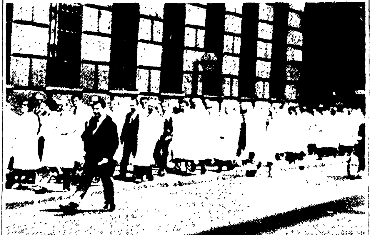
MILANO. - Un corteo per le strade della città lombarda hanno tenuto ieri i medici ospedalieri per richiedere miglioramenti delle retribuzioni.