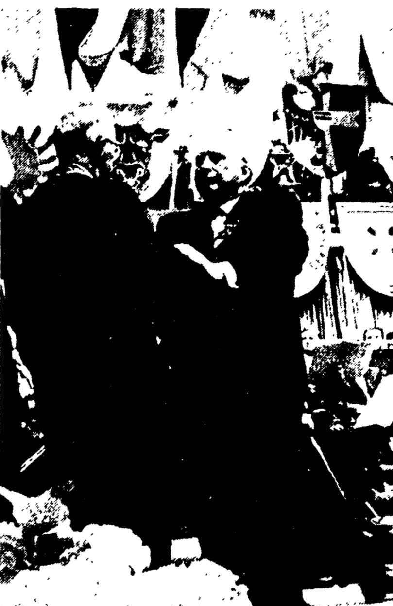
BONN — Una recente foto del nazista Seebom mentre decora uno degli appartamenti alle organizzazioni neo-naziste della Germania occidentale

rivendicato un diritto all'autodeterminazione per i tedeschi dei Sudeti, ma l'ha negato ai cecoslovacchi: « la questione — egli ha detto — deve essere risolta attraverso un referendum nel quadro di un nuovo ordine europeo, senza confini nazionali ». Quanto ai cecoslovacchi che oggi risiedono nella regione dei Sudeti, Seebom ha detto che tale problema non lo riguarda. « Del resto — ha aggiunto — molti di loro torneranno certo volontari nelle loro primitive sedi ». In parole chiare: i tedeschi dovrebbero ritornare nei Sudeti, i cechi e gli slovacchi dovrebbero essere annessi alla Germania, con la stessa operazione che Hitler effettuò nel 1938. Seebom, da innetterato revanscista, ha sposato anche la