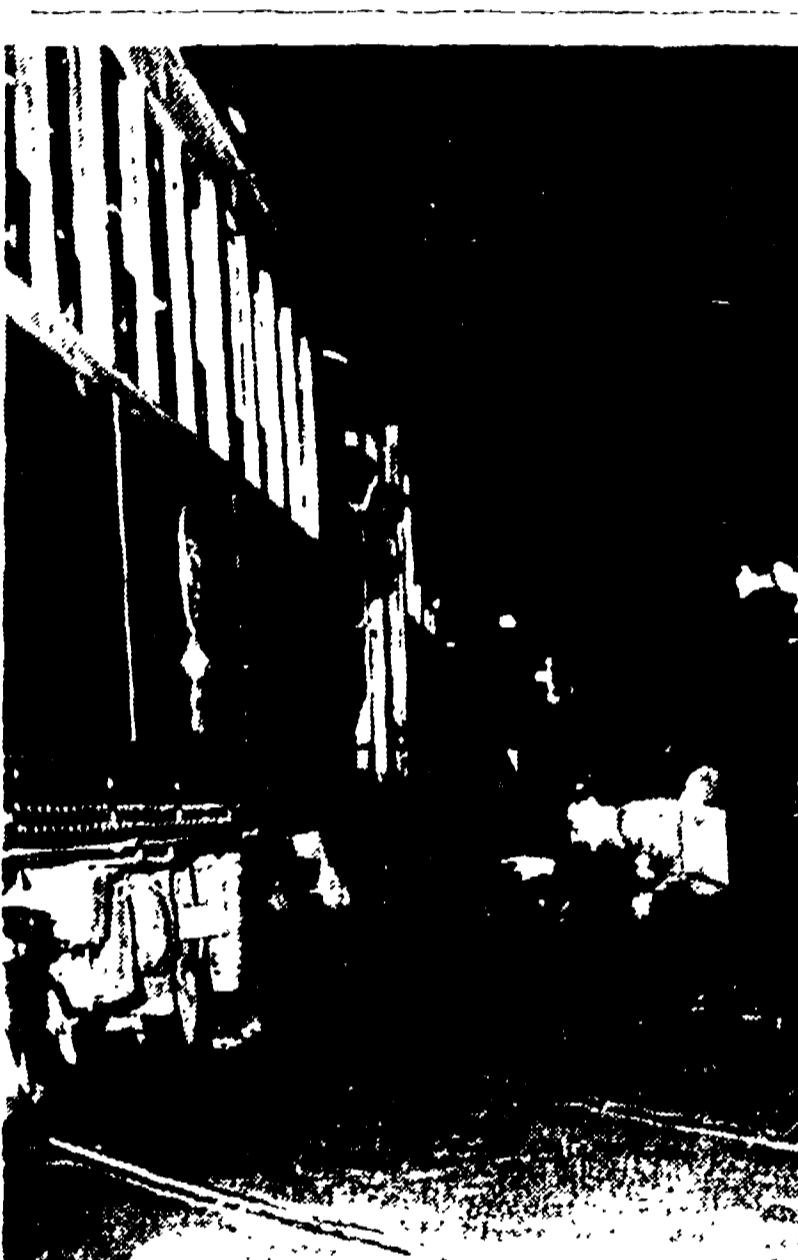
Vigili del Fuoco, polizia e passanti dinanzi al cadavere del ragazzo imprigionato sotto le ruote del tram

Una raccapricciante sciagura ha paralizzato ieri sera per ore viale Manzoni facendo correre una folla che non si passava del tempo e diventava enorme. Un ragazzo di 18 anni, nel tentativo di salire a bordo di una vettura della Stefer, è stato trascinato per decine di metri. Per liberare il corpo dalla ruota del tram, i vigili del fuoco hanno dovuto sollevare la pesante vettura con l'aiuto di un gru.