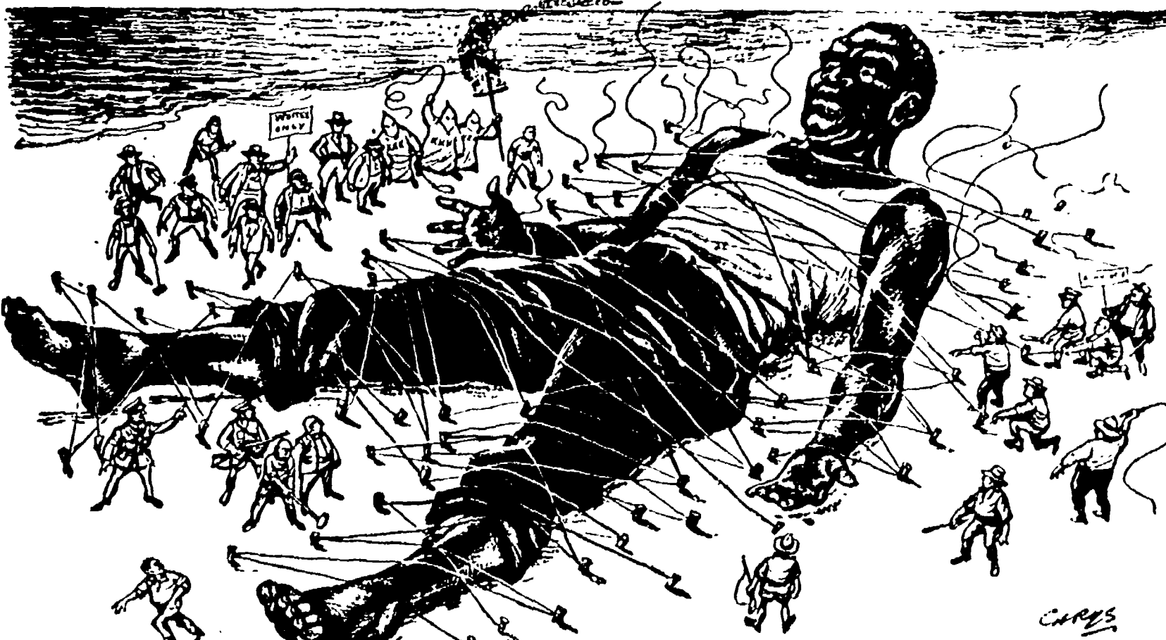
Una vignetta sul risveglio del Sud-Africa del disegnatore Chrys, apparsa sul giornale inglese «News of the World». Si intitola: «Il risveglio di Gulliver». Sul cartello dei «bianchi» si legge: «Solo per bianchi» e «Apartheid».

Nonostante il terrore il 50% dei negri sciope ra a Johannesburg, Durban e Port Elisabeth