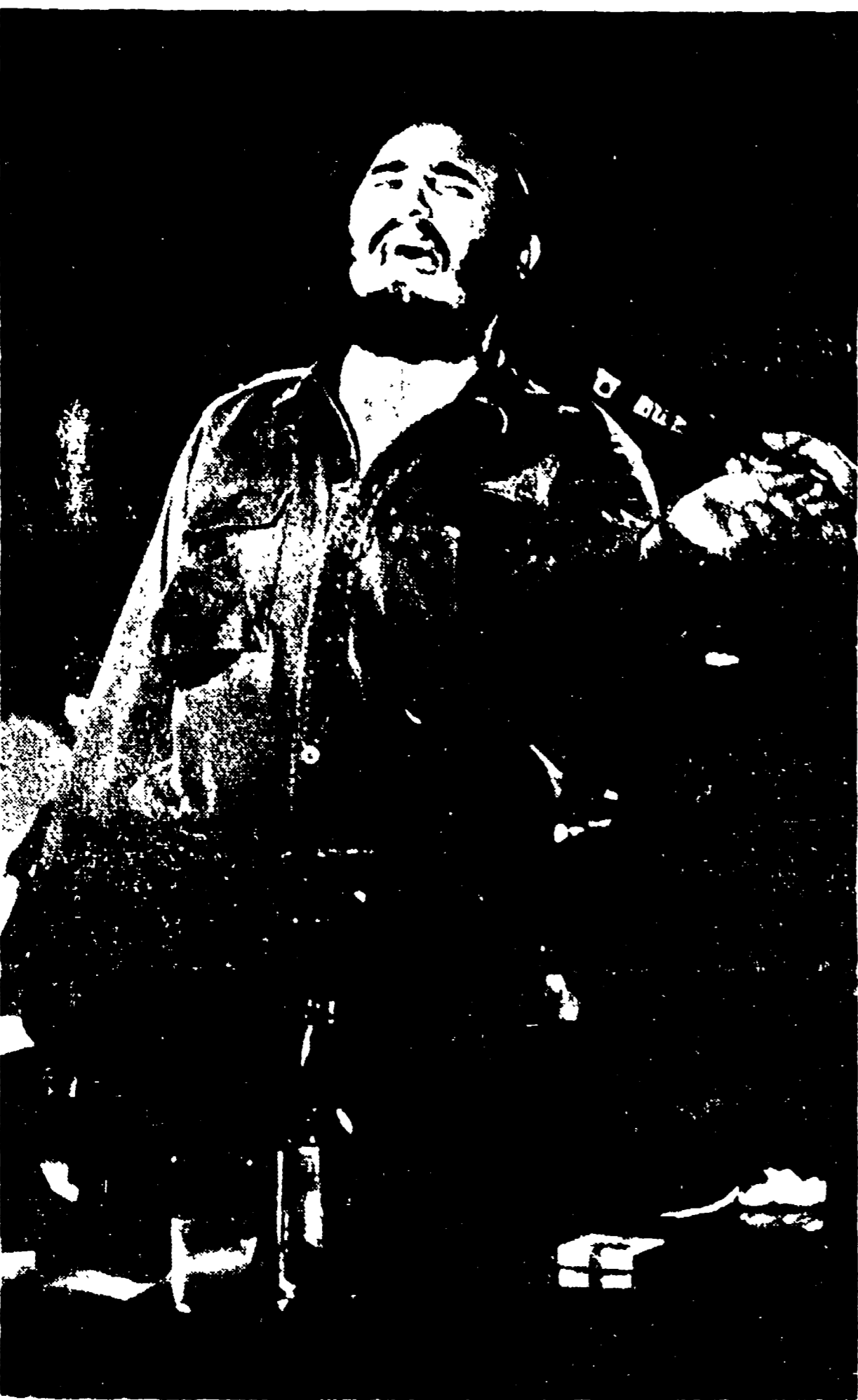
Fidel Castro ritratto mentre parla durante gli interrogatori televisivi dei mercenari prigionieri