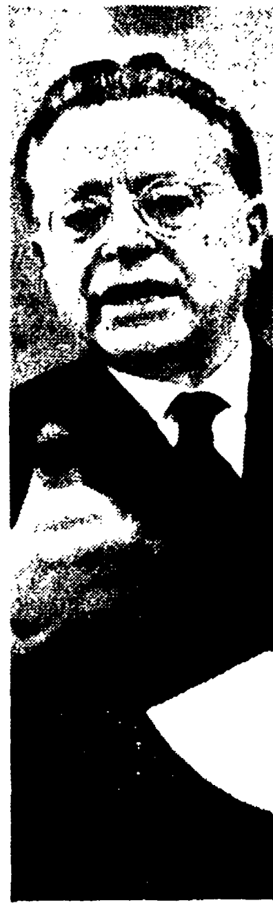
Il Comitato centrale del PCI ha proseguito ieri i suoi lavori che si sono conclusi nella serata. Nel corso del dibattito il compagno Togliatti ha pronunciato il seguente intervento:

Esiste fra i giovani un orientamento di critica alla società borghese e di simpatia per il nostro partito. Collegarci non con gruppi ma con le grandi masse giovanili - I compiti del Partito e della F. G. C. I.