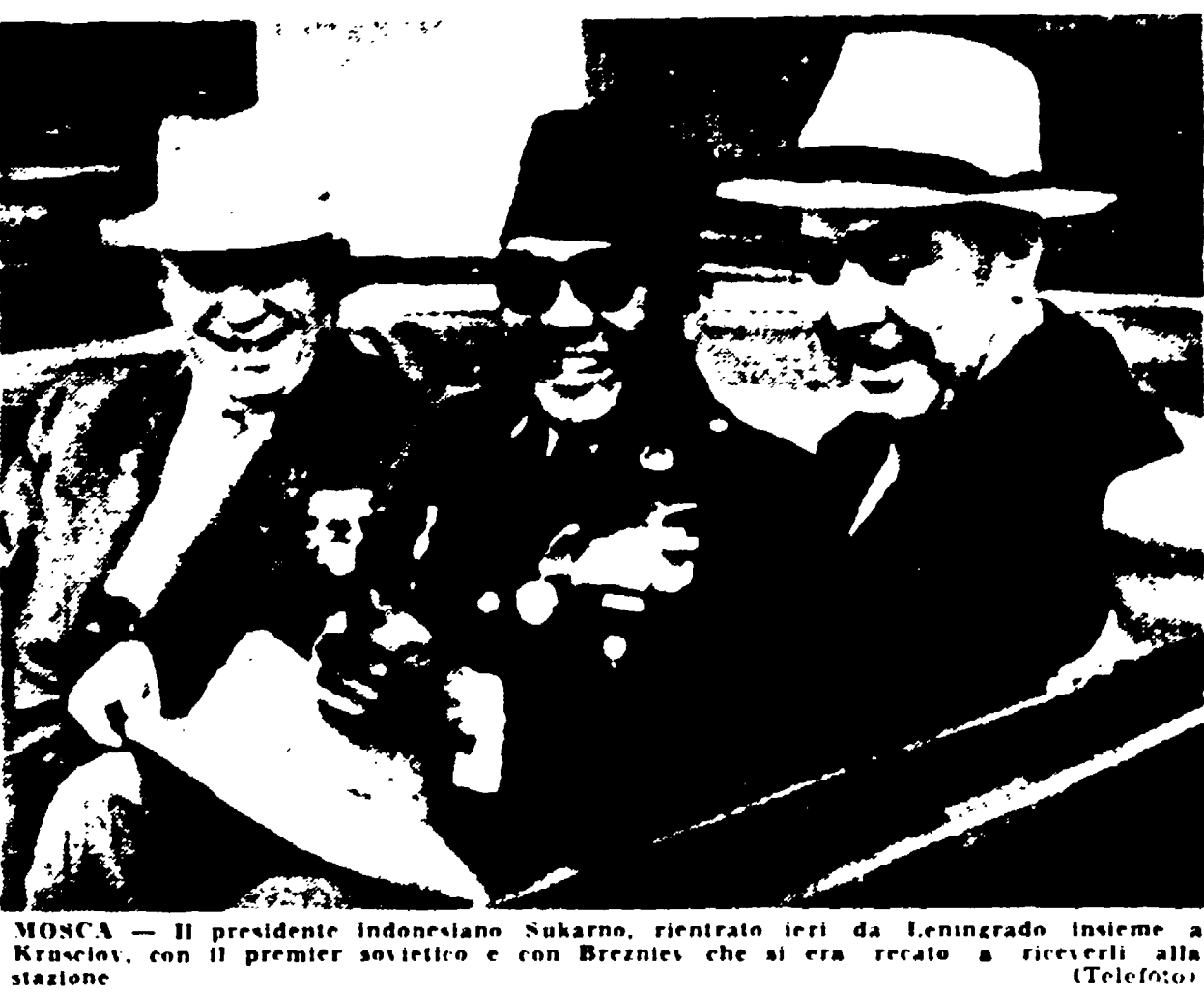
MOSCA - Il presidente indonesiano Sukarno, rientrato ieri da Leningrado insieme a Krusciiov, con il premier sovietico e con Breznev, che si era recato a riceverlo alla stazione.

ricorre agli esempi storici, si trovano delle grandi differenze nel periodo che separa una generazione da un'altra, intendendo il periodo in cui avviene una svolta nell'orientamento delle masse giovanili.