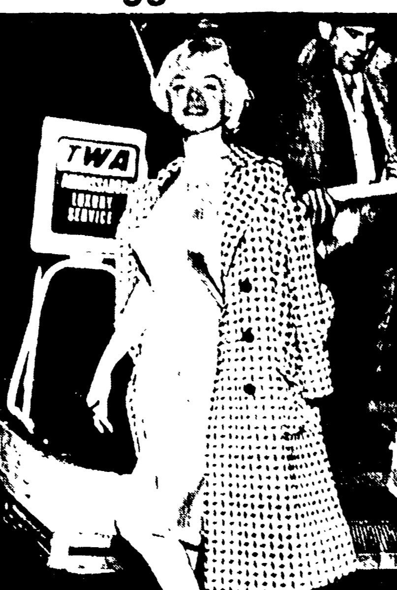
NEW YORK — Marilyn Monroe, fotografata all'aeroporto di New York, proveniente da Los Angeles, ove ha dichiarato di essersi recata per affari (Telefoto)