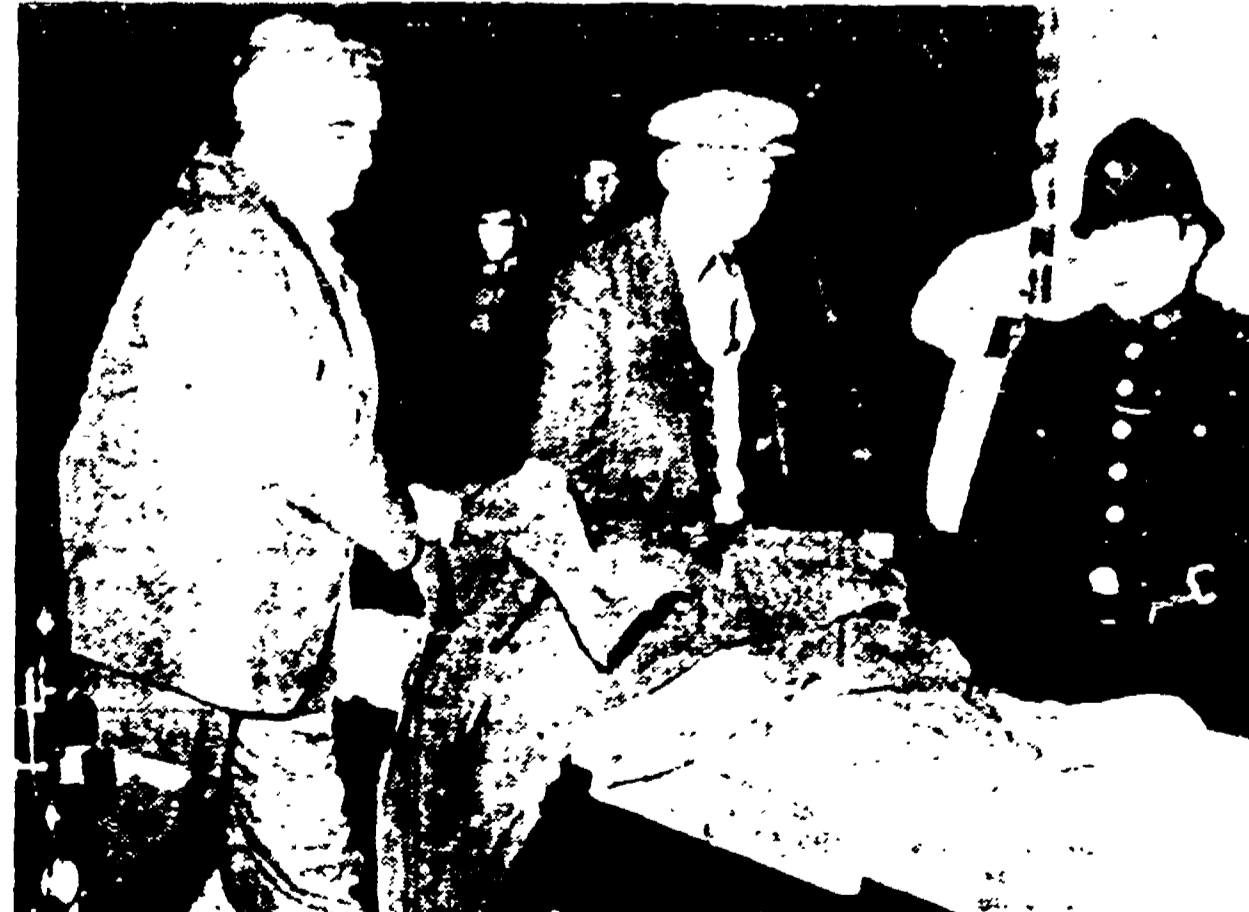
WEMBWELL. — Tre uomini delle squadre di soccorso riportano alla superficie il corpo di una delle vittime della miniera. Il corpo è coperto con una delle pesanti giacche dei minatori

I quattro lavoratori sono rimasti sepolti da un crollo - I soccorritori li hanno trovati morti all'alba