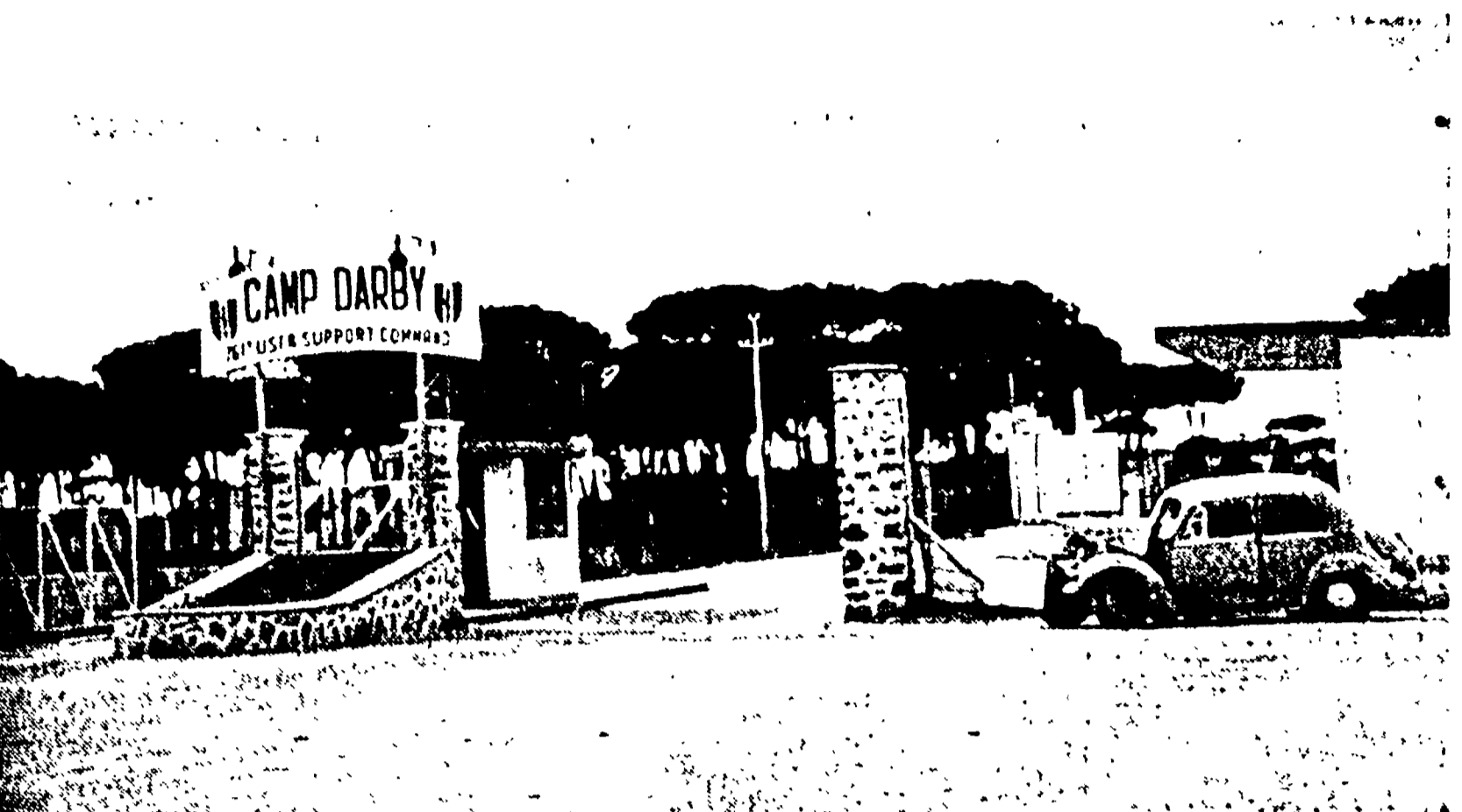
LIVORNO — Uno degli ingressi di Camp Darby

L'incivile trattamento inflitto dalle autorità U.S.A. — Costretti a firmare una dichiarazione con la quale affermano di essersi sottoposti al trattamento volontariamente « perchè sospettati di furto »