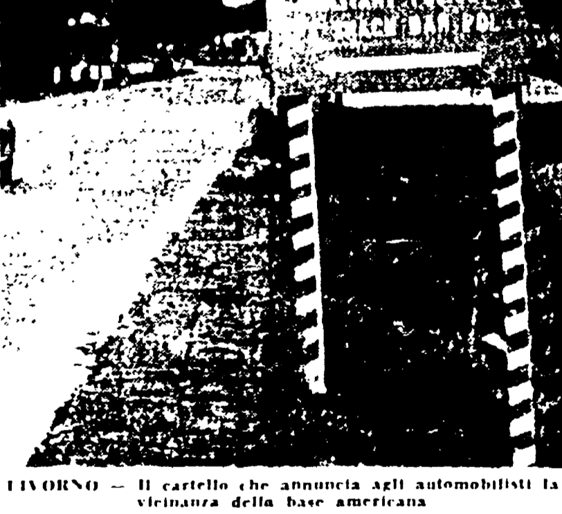
LIVORNO — Il cartello che annuncia agli automobilisti la vicinanza della base americana