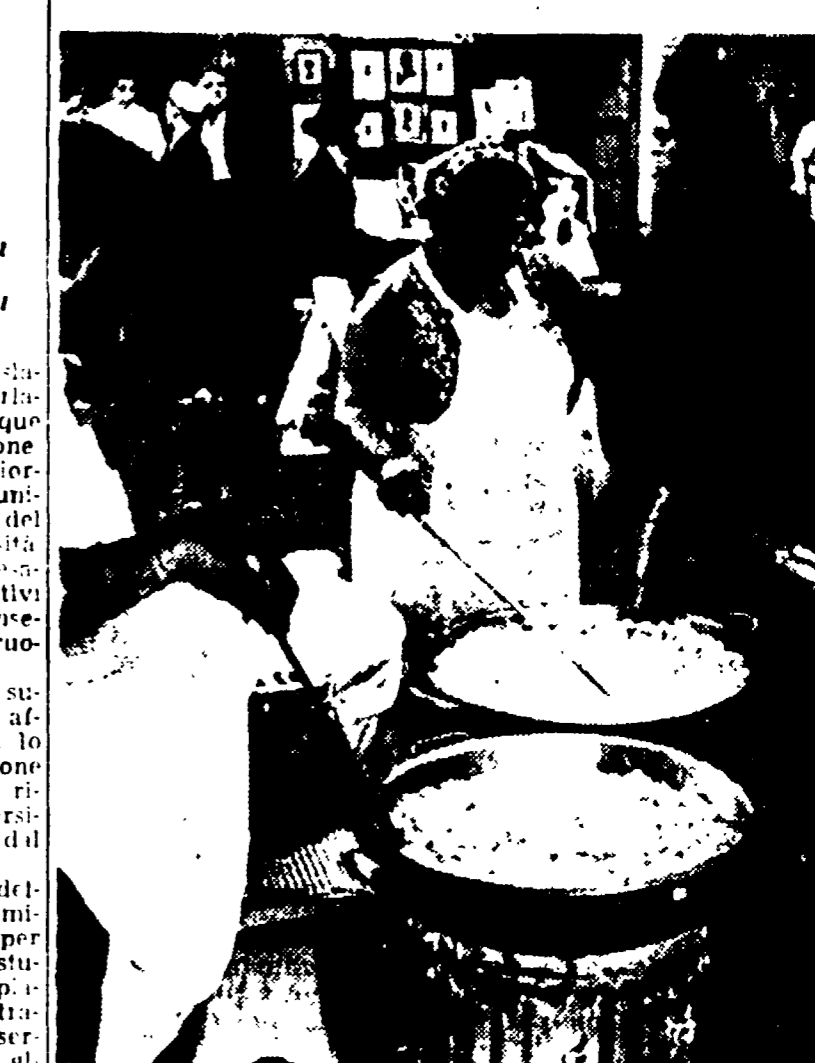
NEW YORK - È stata organizzata nella città statunitense la Festa della cucina italiana, che viene tenuta all'aperto nel popolare quartiere di West Side. Enormi padelle poste ai margini servono per friggere calzoni e zepolle (Telefoto)