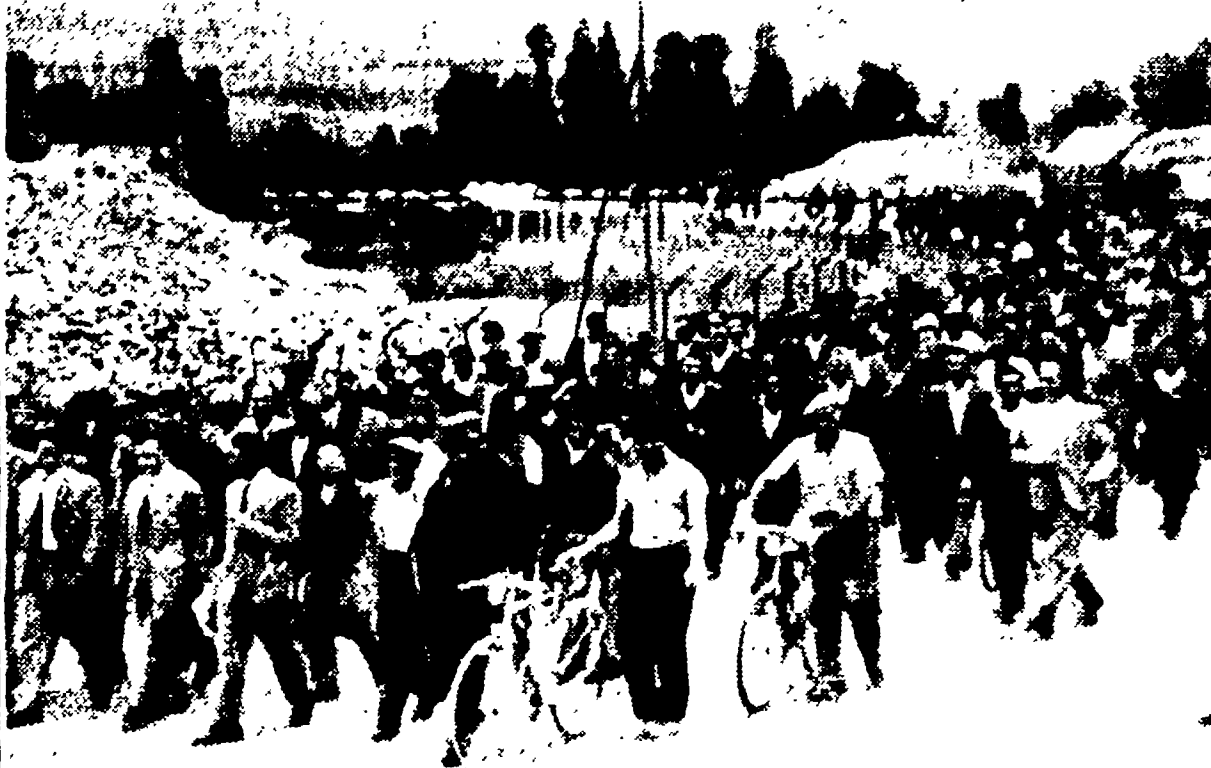
SCAFA - Un corteo di minatori della SAMA durante una delle giornate di sciopero

Forte manifestazione di edili ieri per le vie di Pescara - Anche alla CELDIT di Chieti gli operai si battono per ottenere salari collegati al rendimento