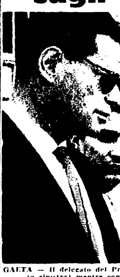
GAETA - Il delegato del Procuratore generale della Corte di Giustizia di Israele Shimon...