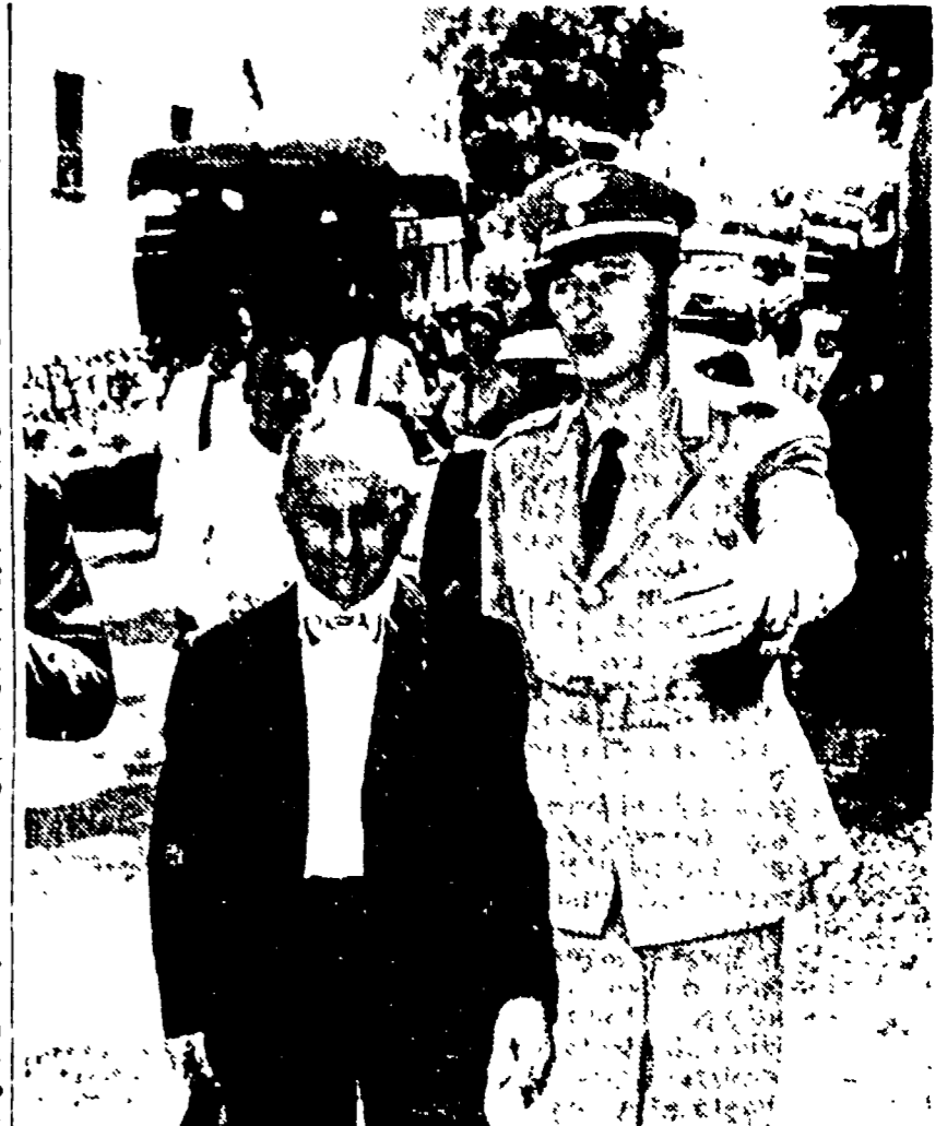
Il sostituto procuratore di Roma Leopoldo Baumgarten...