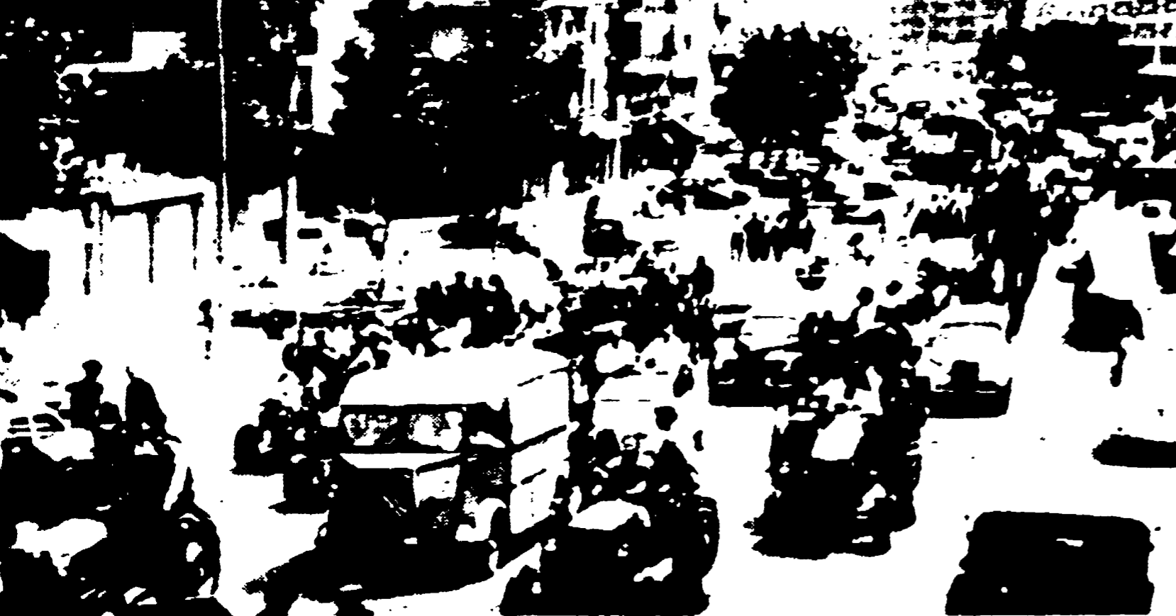
GRENOBLE - Una via della città bloccata da trattori e carri agricoli che sfilano in corteo...

Nuovi dipartimenti in lotta - Migliaia di trattori hanno bloccato decine di centri