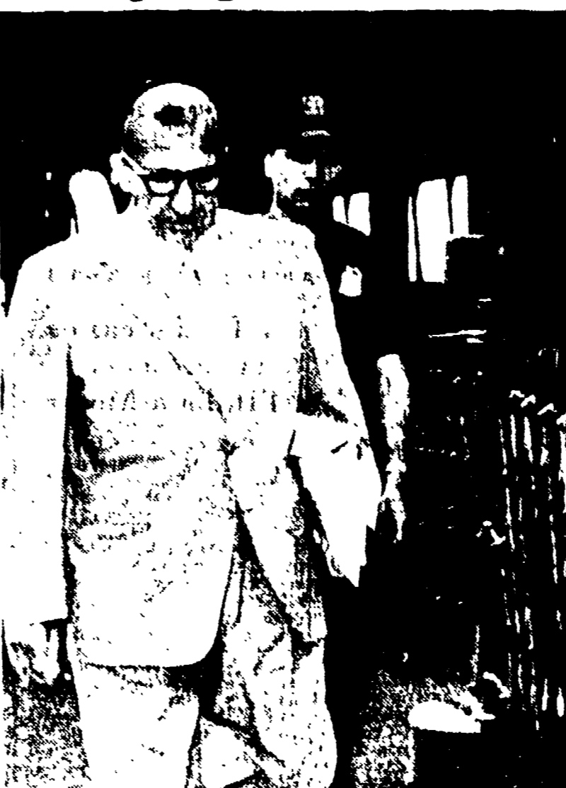
NEW YORK — Dopo una breve detenzione in seguito a un attentato contro la casa di Costello, il gangster è stato rilasciato dalla prigione di Rikers Island, accompagnato da un poliziotto mentre giunge, con il telex-bus, nella metropoli statunitense.