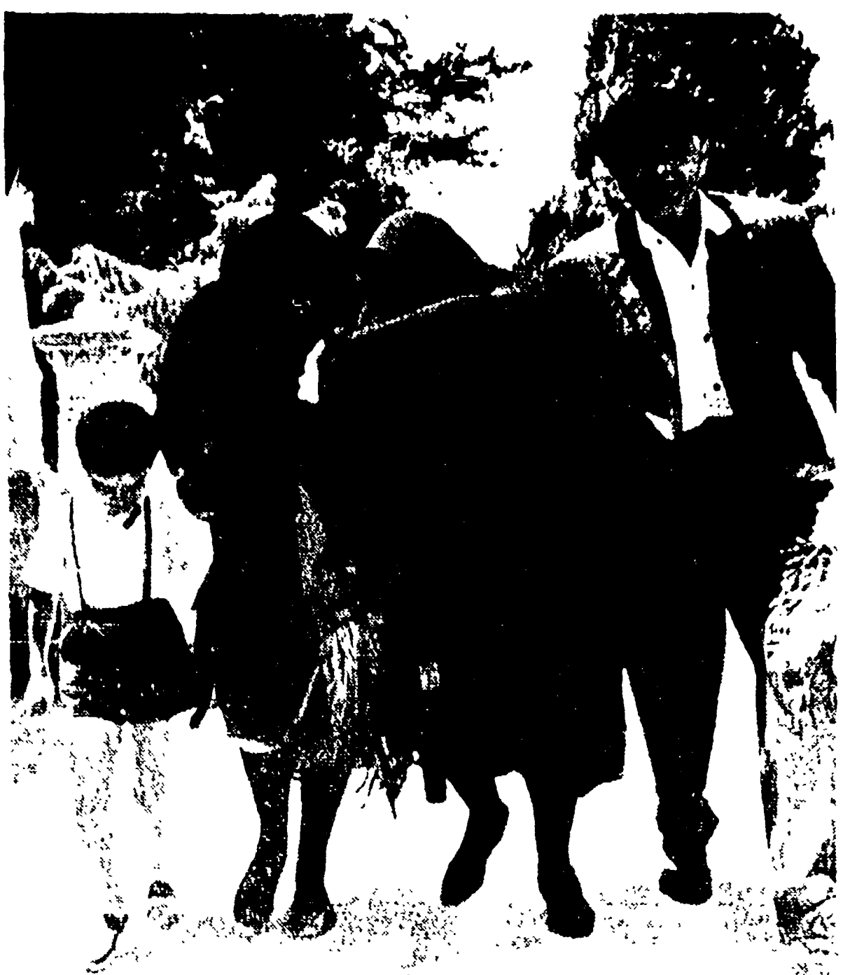
Una drammatica immagine del film dedicato al bandito Giuliano dal regista Francesco Rosi. La scena ricostruisce i funerali delle vittime di Portofino