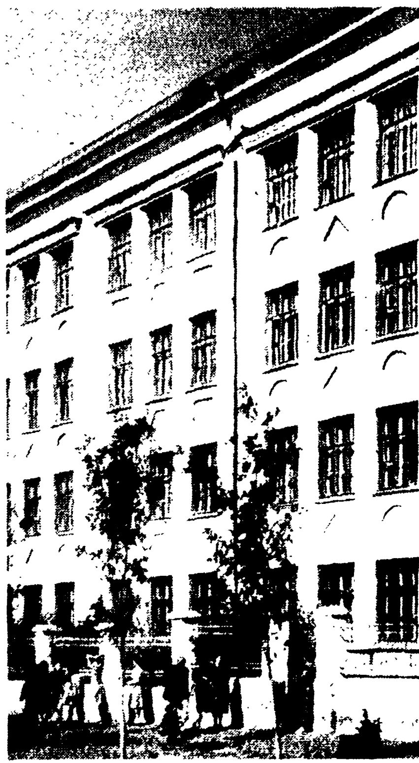
STALINGRADO - Un gruppo di nuove case operaie