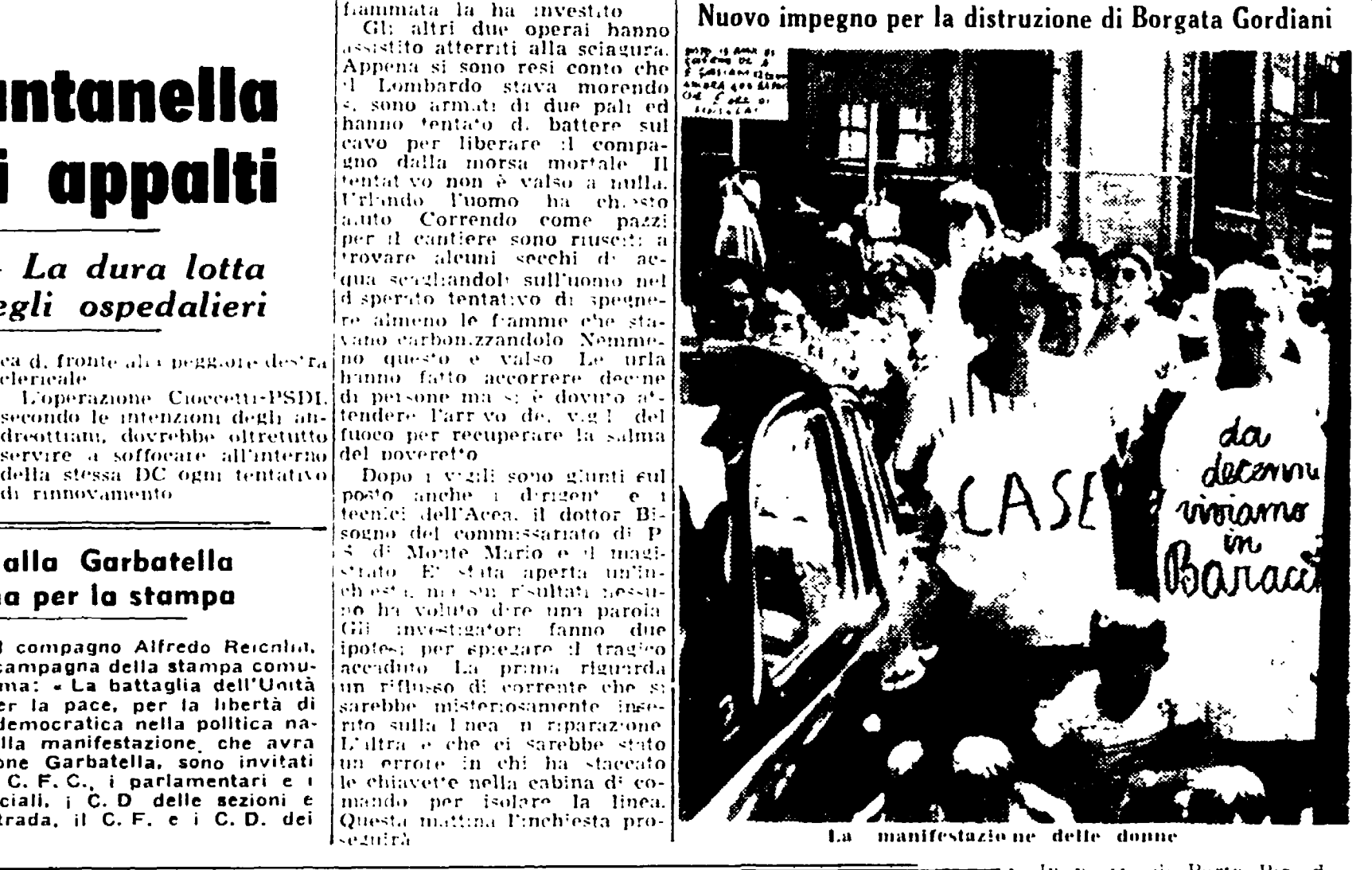
La manifestazione delle donne

Lunedì 3 luglio alle 18.30 il compagno Alfredo Reichlin, direttore dell'Unità, aprirà la campagna della stampa comunista a Roma parlando sul tema: « La battaglia dell'Unità e della stampa comunista, per la pace, per la libertà di informazione, per una svolta democratica nella politica nazionale e in Campidoglio ». Alla manifestazione, che avrà luogo nel giardino della sezione Garbatella, sono invitati i compagni del C.F. e della C.F.C., i parlamentari e i consiglieri comunali e provinciali, i C.D. delle sezioni e delle cellule aziendali e di strada, il C.F. e il C.D. del circolo della F.G.C.I.