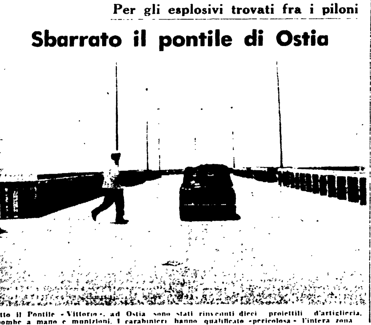
Sotto il Pontile - Vittorio - ad Ostia sono stati rinvenuti dieci prototipi d'artiglieria, bombe a mano e munizioni. I carabinieri hanno qualificato «pericolosa» l'intera zona.

Il Partito Campagna per la stampa Convegno artigiani Comitato Federale e Commissione Federale di Controllo Sezione Alessandrina Turisti in via Po! La notte migliaia di turisti che affollano quotidianamente via Po ammirano ed acquistano le magnifiche confezioni per uomo della Ditta Superbitto. La Ditta Superbitto ha trasformato le proprie vetrine in autentiche mostre pittoriche delle migliori confezioni complete, giacche, pantaloni, stoffe delle migliori marche in un vasto assortimento. Sartoria di classe. Tutti in via Po, 39-F (angolo via Sisto) le qualità migliori a prezzi più convenienti di Roma.