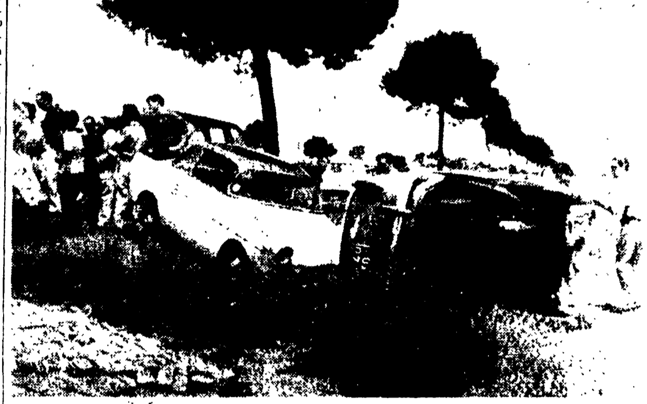
La «1100» e la «600» fuori serie subito dopo il pauroso scontro

Mortale investimento nella tarda mattinata di ieri in piazza Ungheria, angolo viale Lazio. Un'anziana signora è stata travolta e uccisa da un camioncino di passaggio. La signora, di anni 70, stava attraversando la piazza quando è stata travolta dal camioncino. Il camioncino ha investito la signora e l'ha trascinato per alcuni metri. La signora è morta sul colpo. Il camioncino è stato sequestrato e l'autista è stato arrestato. La causa dell'incidente è stata attribuita al fatto che il camioncino non aveva i freni a mano.