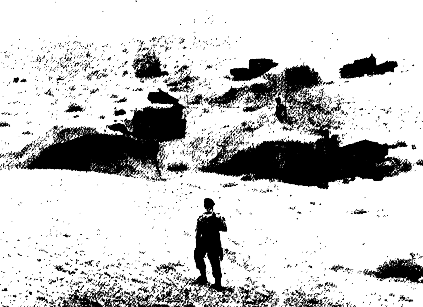
KUWAIT — Un accampamento inglese al confine fra il Kuwait e l'Irak, 20 Km. a nord della città di Kuwait

BEIRUT, 3. — L'Irak ha oggi formalmente accusato la Gran Bretagna di « aggressione » ed ha affermato che il concentramento delle truppe inglesi nel Kuwait costituisce « una diretta e pericolosa minaccia alla sicurezza dell'Irak e di quella dei paesi arabi ».