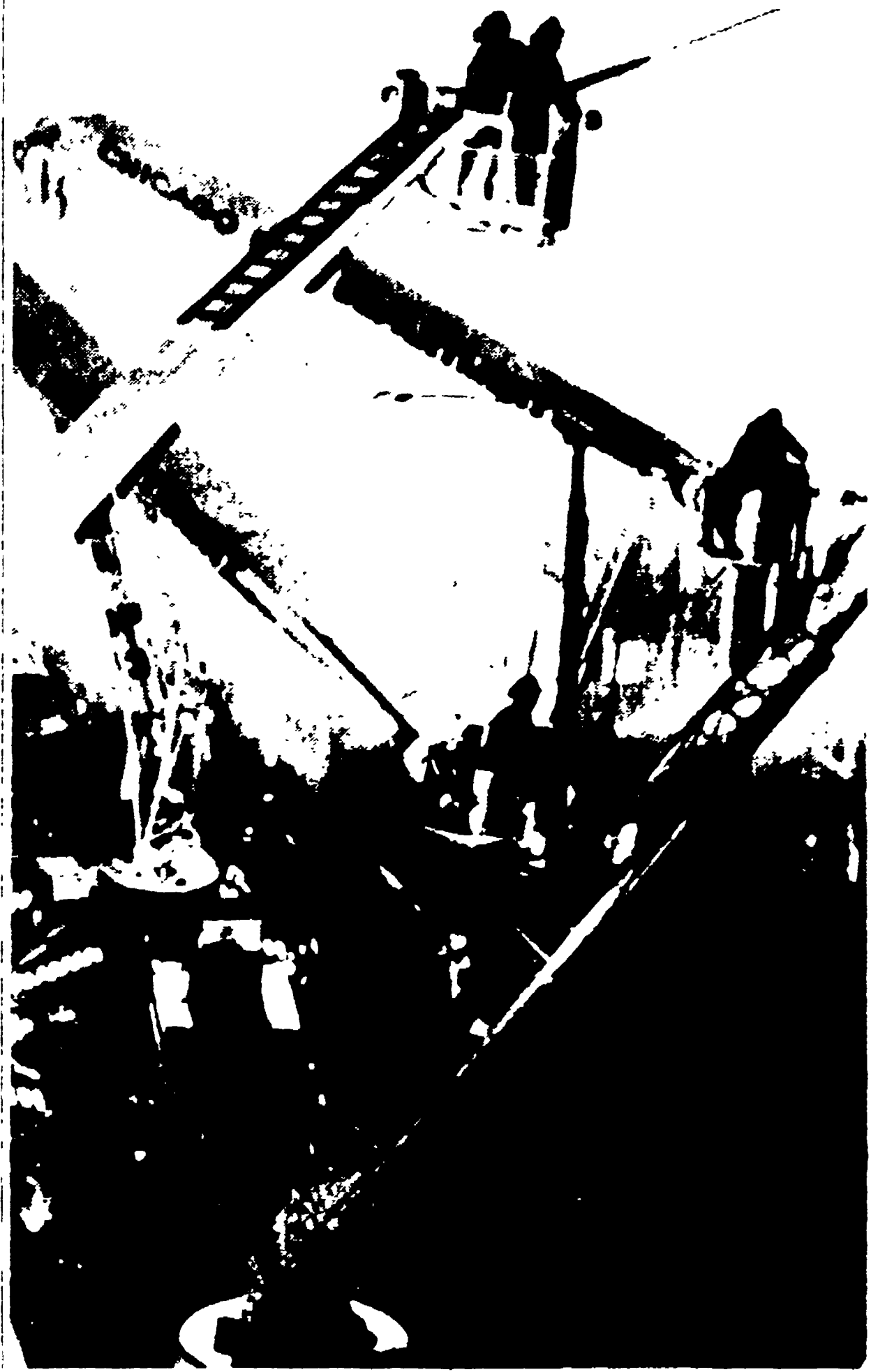
CHICAGO — I vigili del fuoco di Chicago hanno inaugurato un nuovo strumento di lotta contro gli incendi. Si tratta di speciali « gabbie » su torri, dette « snorkels » (specie di macchinari idraulici) installati sui camion che consentono di usare gli idranti da posizione elevata e con maggiore sicurezza, facilitando così il raggiungimento dei locali che sono difficili da raggiungere.