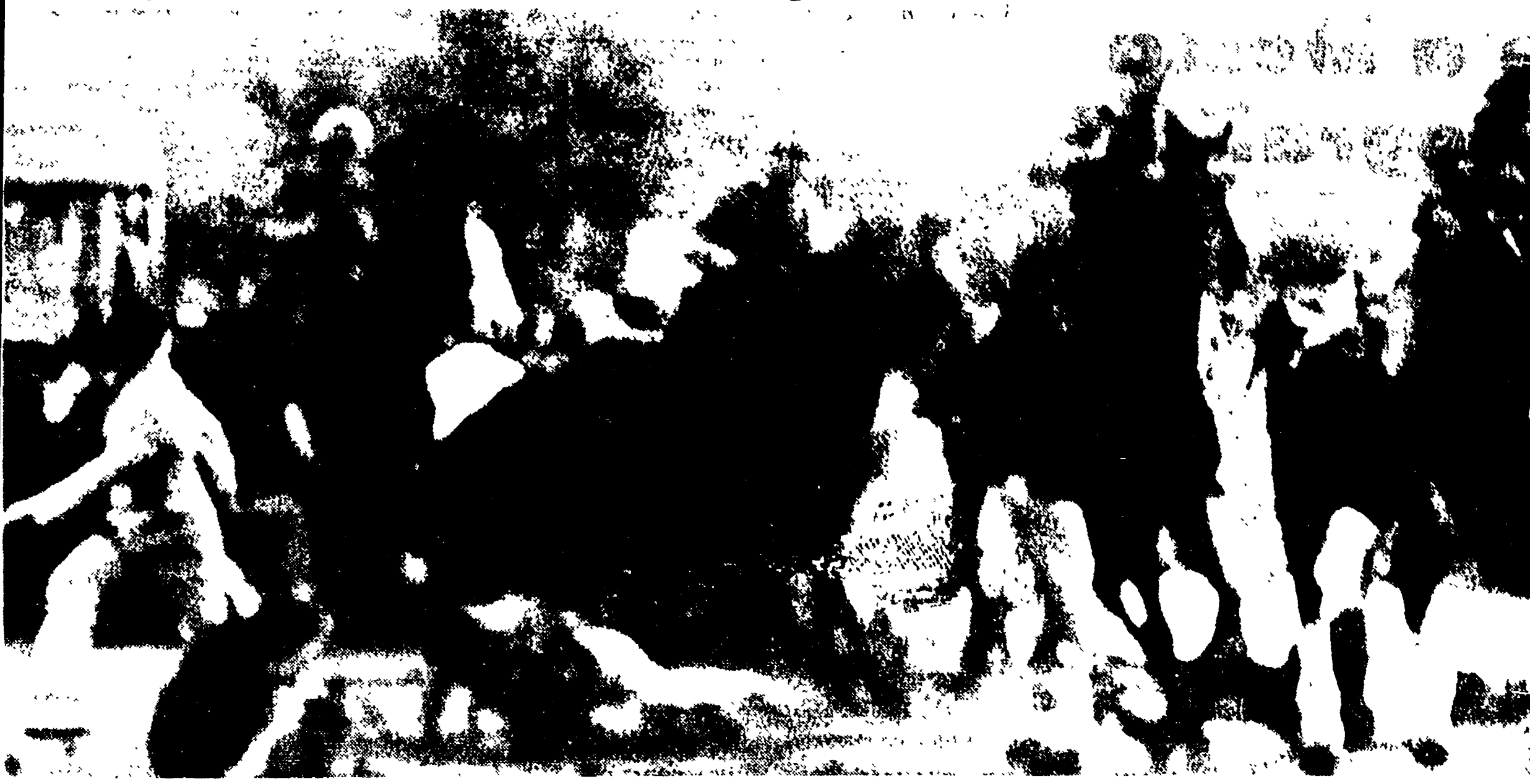
È passato un anno. Quel giorno un grande corteo guidato dai parlamentari democratici recò una corona alla lapide dei caduti durante la Resistenza. La polizia di Tamburini si scagliò sugli antifascisti con furia selvaggia. Fu respinta. Per ore nelle strade di Testaccio il popolo — con i giovani in prima fila — rintuzzò le critiche degli uomini armati di manganello di schiabi, di pistole. E vinse. Nel giorno successivo i questurini spararono e uccisero a Reggio Emilia, a Palermo, a Catania. Ma il potente moto antifascista, che partì da Genova scosse l'intero paese. In un travolgere il governo clerico-fascista.

I giudici non hanno creduto « al delitto d'onore »