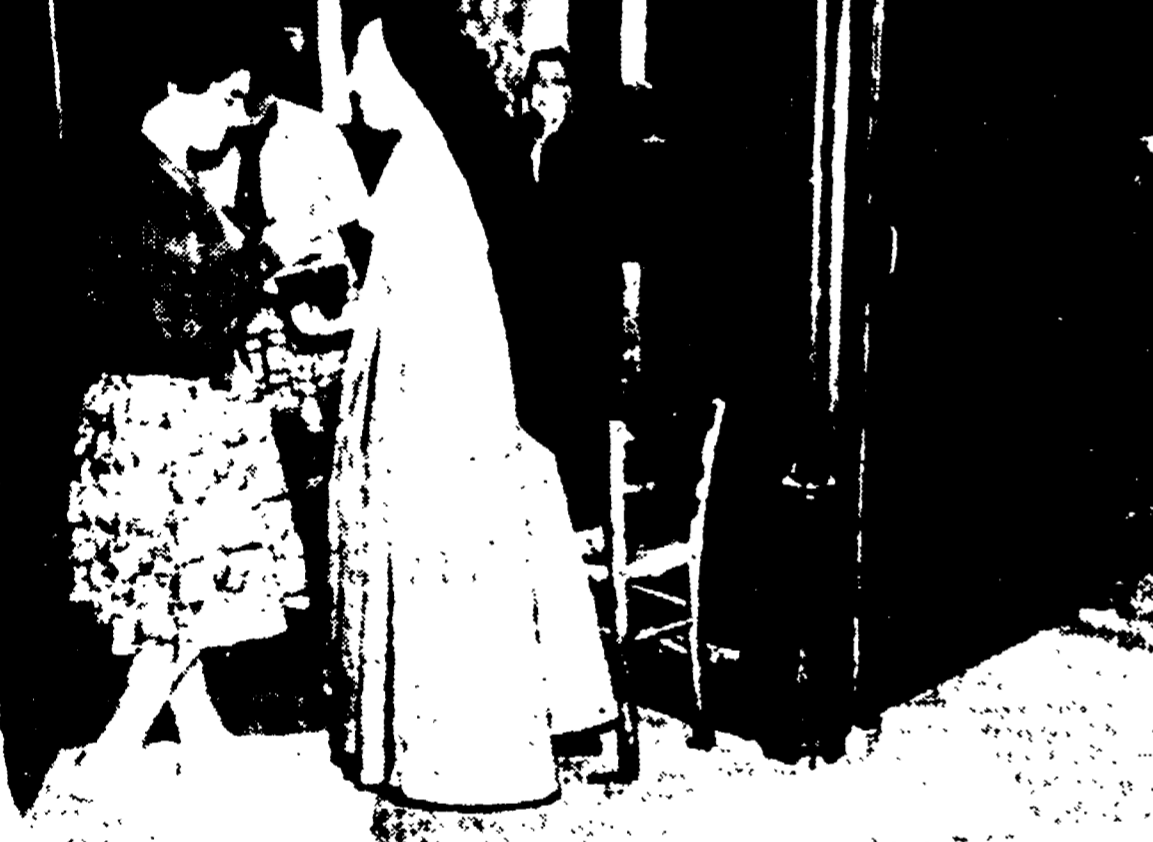
PARIGI — Una neonata è stata trovata morta nella sua carrozzina, dentro la cattedrale parigina di Notre Dame, proprio davanti all'ingresso. È stata una suora a fare la scoperta. La bimba che aveva i capelli scuri e l'apparente età di sei settimane, portava un corredo costoso. Nella carrozzina c'erano anche due magliette per bambini e un pullover da donna. L'autorità giudiziaria ha ordinato l'autopsia per accertare la causa della morte. Nella telefoto: il luogo dove è stato trovato l'infante.