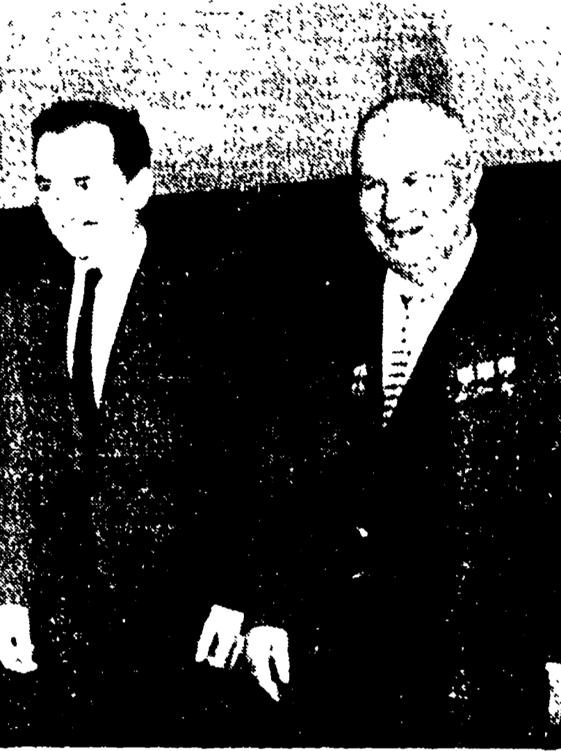
MOSCA. Krusciov ha ricevuto ieri al Cremlino il ministro degli esteri Jugoslavo, Popovic. Nella foto: i due statisti ritratti dopo l'incontro.