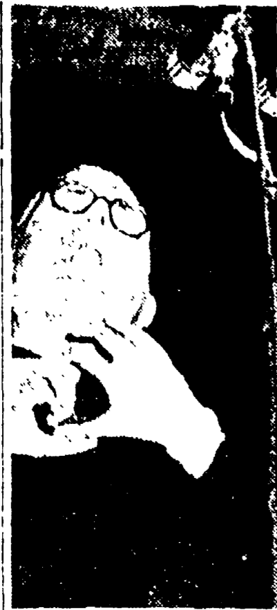
Il «microfono di Dio»

Padre Lombardi, il microfono di Dio, tornato fresco fresco dalla Spagna tranchiata ora ha tenuto a quei vescovi un corso di esercizi spirituali. La tesi annunciata che questo autunno intende rivivere in tromba per una nuova crociata. Lo stimolo all'azione del fatto che «adesso arde un fuoco che non si spegne» ha constatato che i comunisti in Italia sono ancora una cosa molto seria e che continuano, con la loro presenza «ad arretrare» non si capisce bene che cosa. Quanto a noi, ci limitiamo a rammentare che il «microfono di Dio» continua a essere una cosa diversa da un «microfono di un uomo». Il «microfono di Dio» è un microfono di Dio. L'Unità è un giornale di Dio. Il «microfono di Dio» è un microfono di Dio. L'Unità è un giornale di Dio.