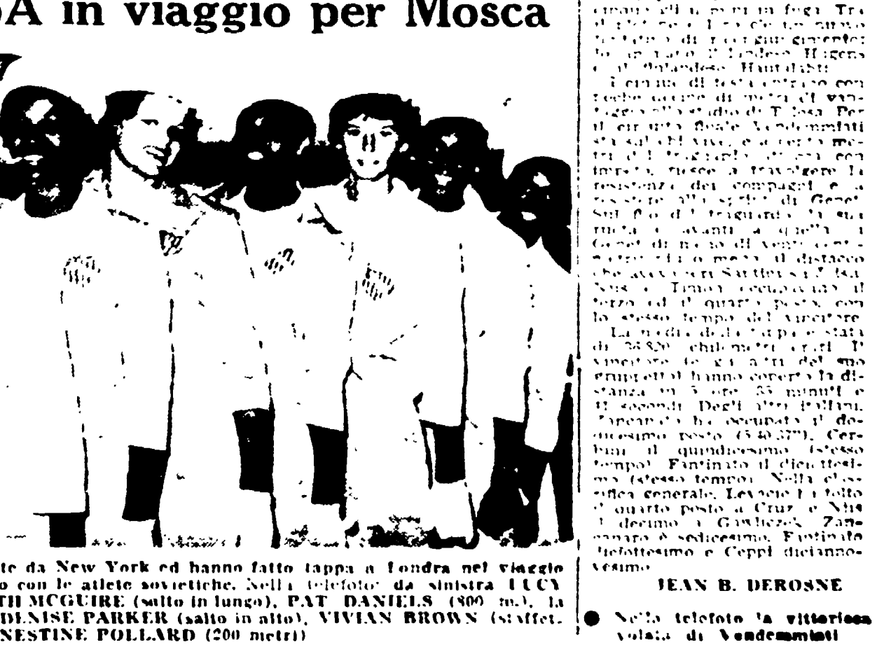
Le atleti americane sono partite da New York ed hanno fatto tappa a Londra nel viaggio verso Mosca... (Caption text is partially obscured)

Le atleti USA in viaggio per Mosca « Le atleti americane sono partite da New York ed hanno fatto tappa a Londra nel viaggio verso Mosca... »