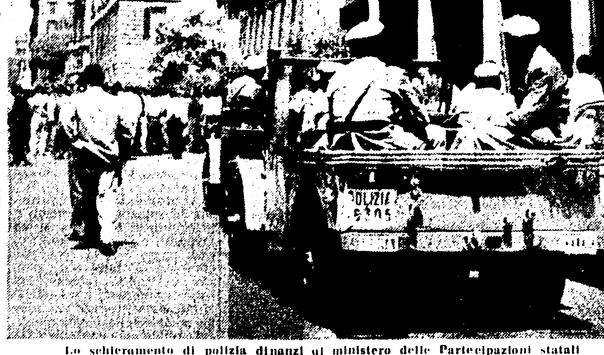
Lo schieramento di polizia dinanzi al ministero delle Partecipazioni statali