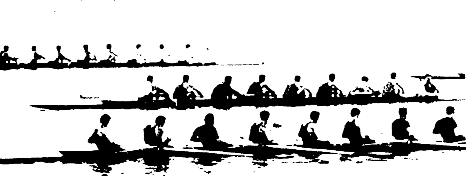
Una fase della gara dell'otto. L'armo della Moto Guzzi, in primo piano, sta producendo lo spunto finale che gli permetterà di tagliare vittorioso il traguardo

La Ginnastica Triestina ha vinto due titoli, nel «due senza» e nel «singolo» — La Falck prima nel «quattro senza» e seconda nel «due senza» — Gli altri titoli alla Finanza di Gaeta, al Posillipo e al Lario