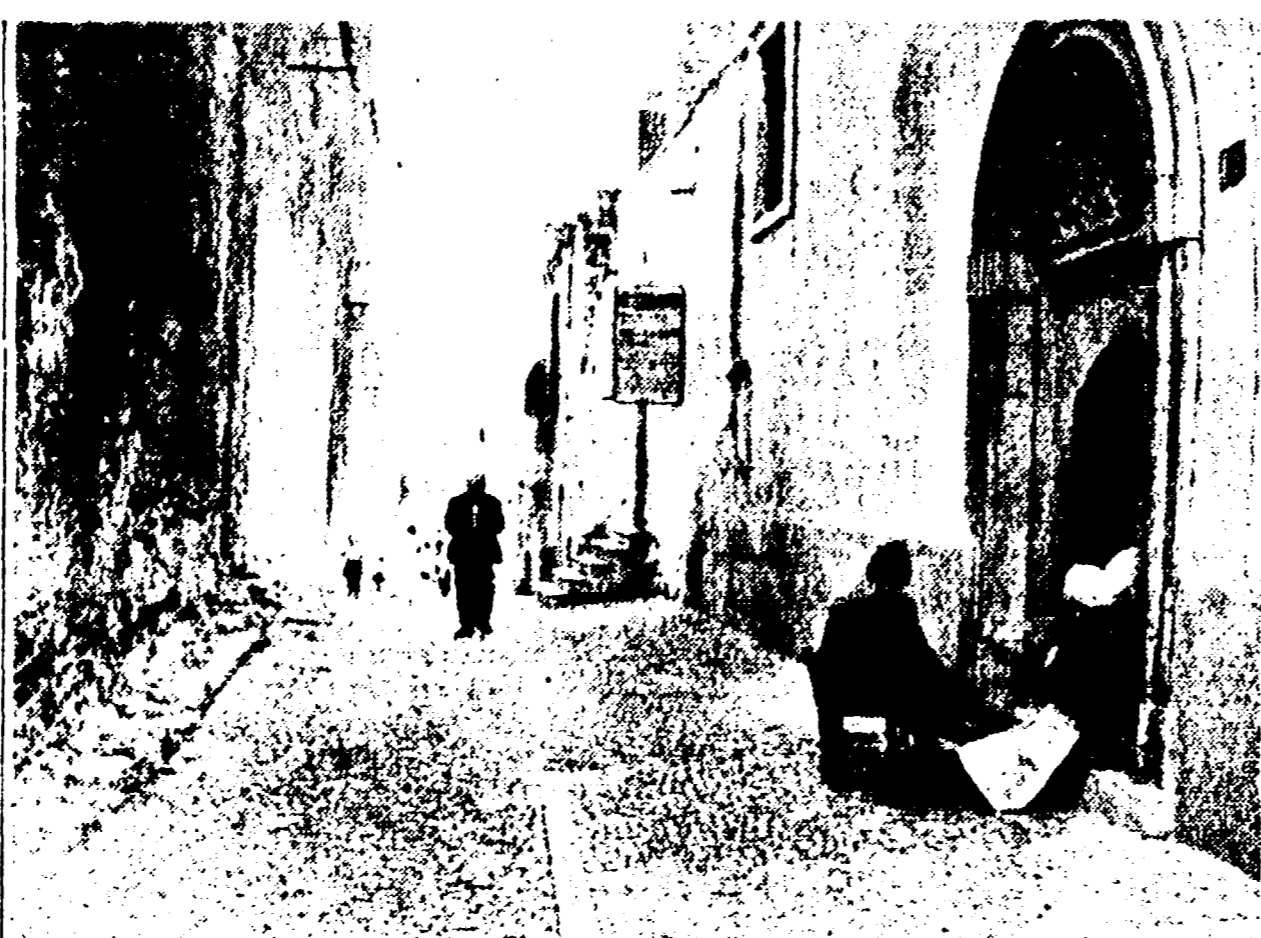
FERRANDINA — Una tipica strada del centro lucano