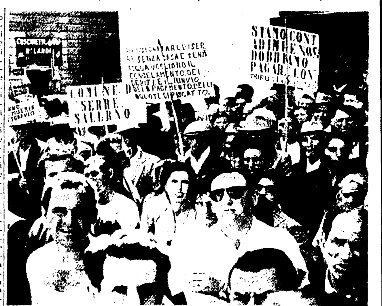
NAPOLI — Un aspetto della manifestazione dei contadini svoltasi ieri