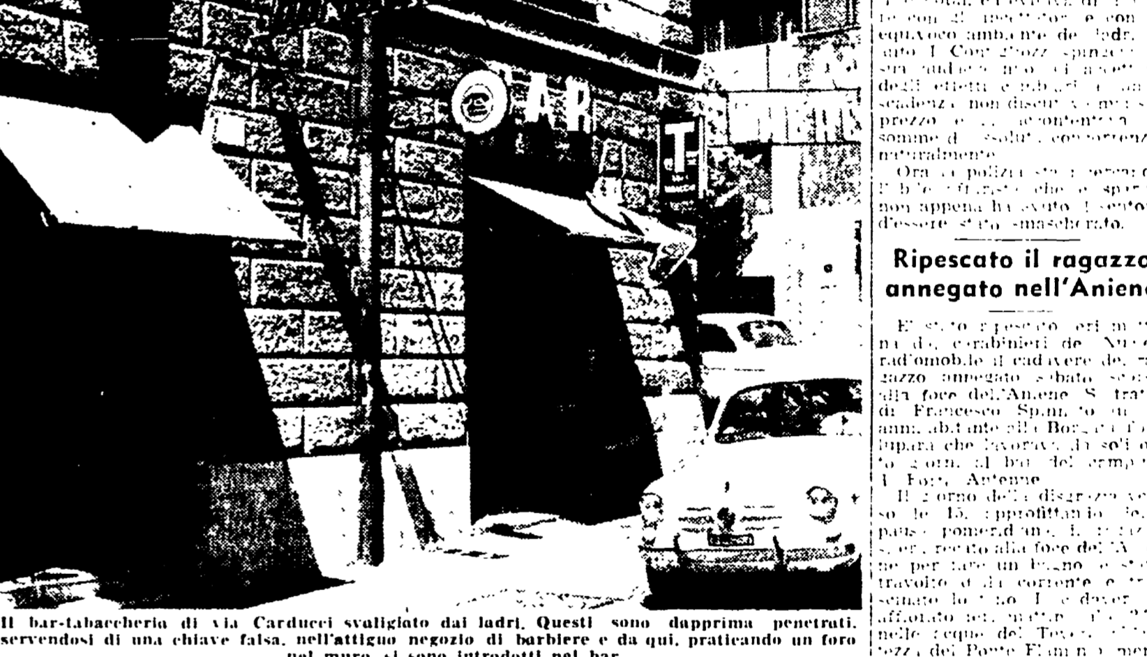
Il bar-tabaccheria di via Carducci svaligiato da ladri. Questi sono doppiamente penetrati, servendosi di una chiave falsa, nell'attiguo negozio di barbiere e da qui, praticando un foro nel muro, si sono introdotti nel bar.

È poi balzato in sella ad uno scooter, che, condotto da un altro giovane, si è allontanato a tutta velocità. Svaligiato un bar-tabaccheria di via Carducci: trafugati tabacchi, valori bollati, liquori per circa 4 milioni.