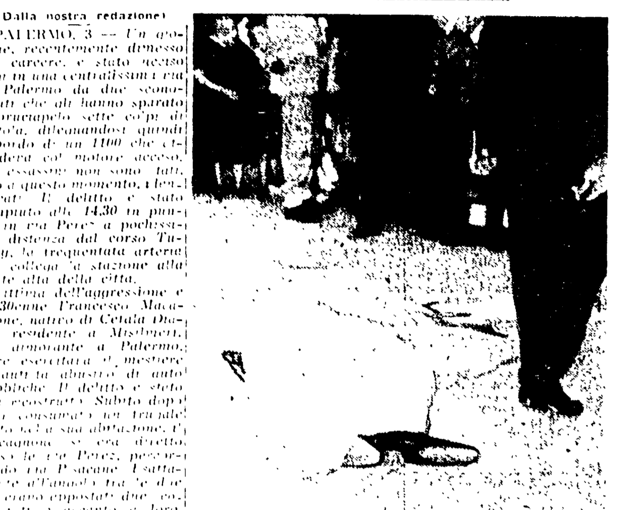
Palermo. - Il corpo di Francesco Macagnone sulla strada.

Gli assassini dopo aver sparato sette colpi si sono dileguati a bordo di una 1100 scura che attendeva col motore acceso