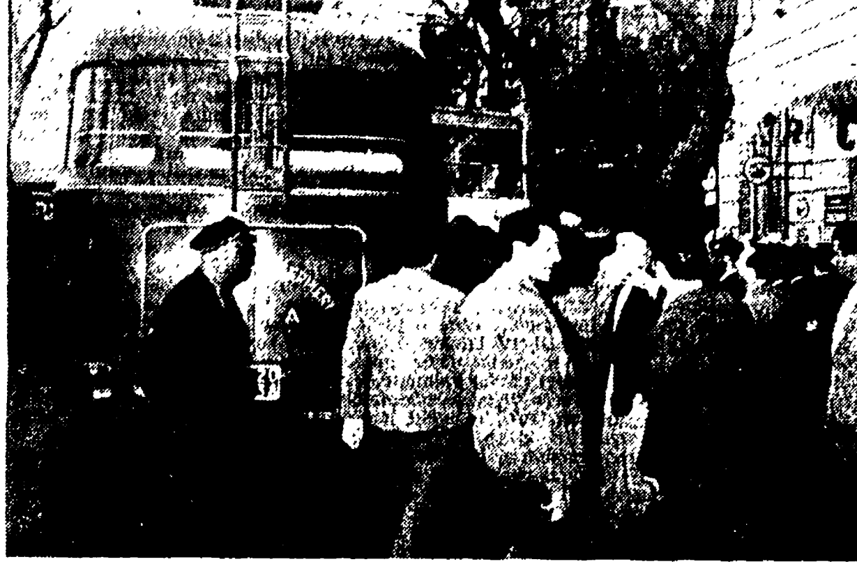
Dal 20 agosto aumenteranno le tariffe anche la autolinee private

Durante il prossimo mese di settembre l'Ufficio statistico del Comune assumerà oltre 2000 persone per un periodo limitato alla elaborazione del X censimento generale della popolazione fissato per domenica 15 ottobre e per il IV censimento generale dell'industria e del commercio che si svolgerà il giorno successivo, lunedì 16 ottobre. I gruppi assunti, suddivisi in gruppi, sezioni e sottosezioni, saranno incaricati della consegna anticipata dei fogli di famiglia e a ritirare i documenti ad operazione ultimata. Il precedente censimento si svolse il 4 novembre 1951 e diede i seguenti risultati: la popolazione di Roma risultò essere di 1 milione e 651 mila 754 abitanti di cui 790.971 maschi e 860.783 femmine. Le famiglie residenti nel territorio comunale (che ha una superficie di 159 mila ettari) erano 425.797 con 1.539.061 componenti. La popolazione residente aveva un risultato di 817.871 unità, di cui 426.619 indipendenti, 201.114 dipendenti ed impiegate, 442.739 lavoratori in genere e 46.922 conduttori. In dieci anni la città si è sviluppata sensibilmente. Al 30 giugno scorso la popolazione residente ammontava a 2 milioni 99 mila 406 unità. Ad operazioni ultimata, tutti i dati raccolti verranno consegnati all'Ufficio statistico comunale, che li invierà poi all'Istituto centrale di statistica per l'elaborazione definitiva.