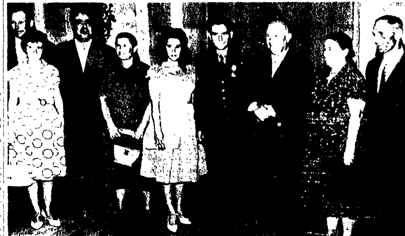
MOSCA - Il cosmonauta Titov con i suoi familiari, fotografato durante il ricevimento al Cremlino insieme a Krušev, e al Presidente del Soviet supremo Breznev (terzo da sinistra)

« Il bilancio è stato sanguinoso: 20 morti e 10 feriti sulle strade italiane, in un giorno di traffico intenso e di congestione. Gli incidenti sono stati causati da una serie di fattori, tra cui la mancanza di manutenzione delle strade e l'alta velocità dei veicoli ».