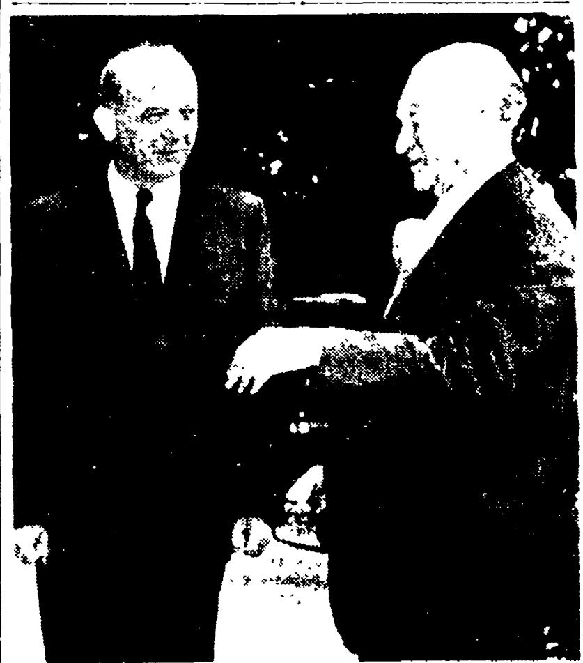
CADENABRIA - L'incontro del segretario di Stato americano, Dean Rusk, con il cancelliere di Bonn, Adenauer a Cadenabbia

WASHINGTON, 10 - La conferenza stampa del Presidente Kennedy, annunciata da diversi giorni, si è svolta oggi alle 15 (ora italiana), ma ha lasciato un po' delusi tutti coloro che l'anno scorso ascoltata il capo dello Stato americano si erano immaginati a qualche dichiarazione piuttosto generica sui principali problemi del momento, in particolare quelli tedeschi.