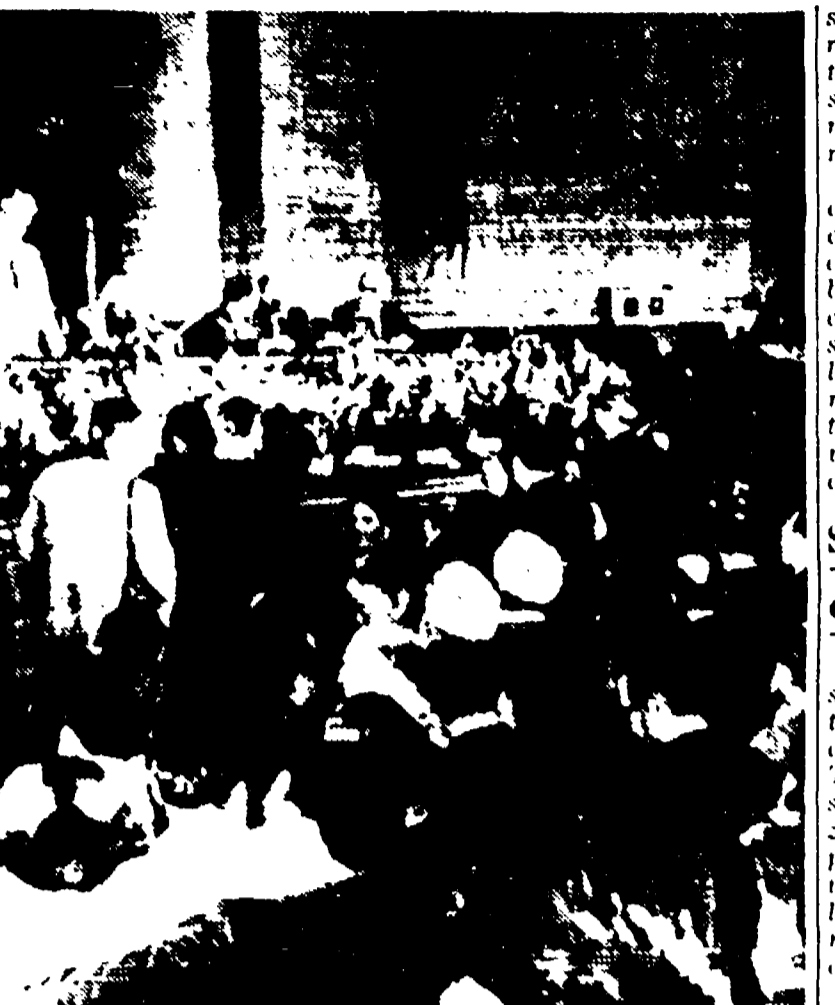
MOSCA — L'Alma Magna dell'Università gremita di giornalisti

« Titov risponde anche a curiose domande dei giornalisti: « Non ho fatto sogni durante il mio sonno cosmico » — « Avrebbero dovuto mandare con me un fotoreporter » — Tutto il materiale visivo filmato a terra ».