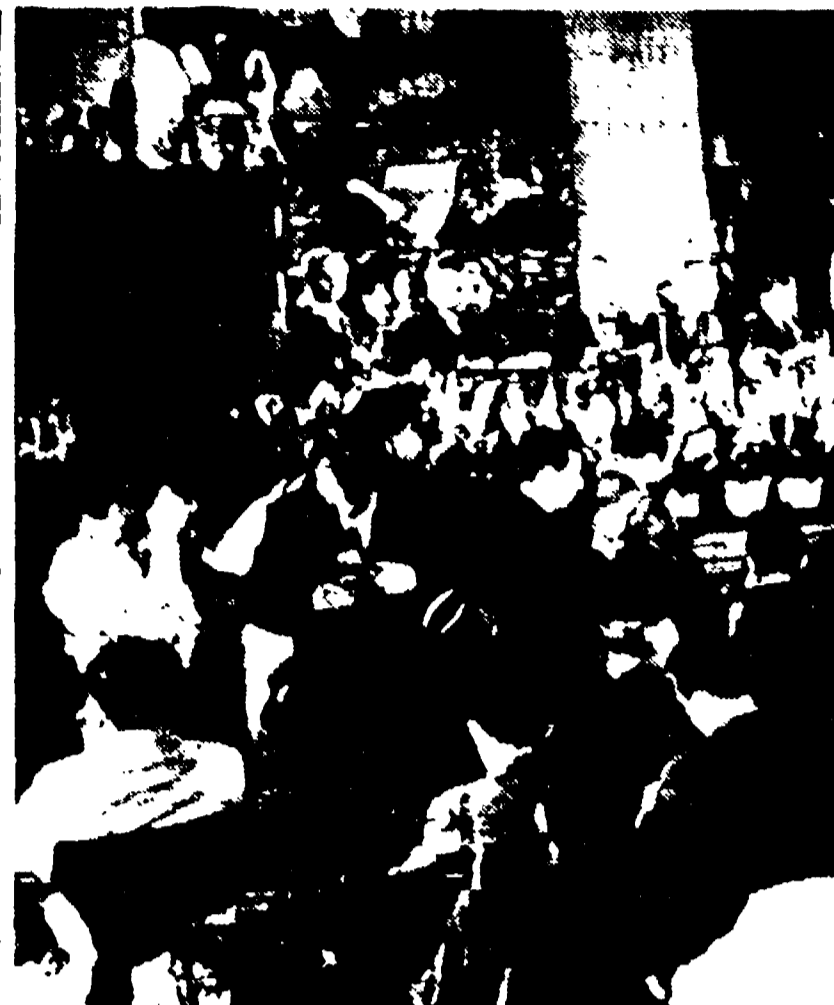
MOSCA — L'Alma Magna dell'Università gremita di giornalisti

« Titov risponde anche a curiose domande dei giornalisti: « Non ho fatto sogni durante il mio sonno cosmico » — « Avrebbero dovuto mandare con me un fotoreporter » — Tutto il materiale visivo filmato a terra ».