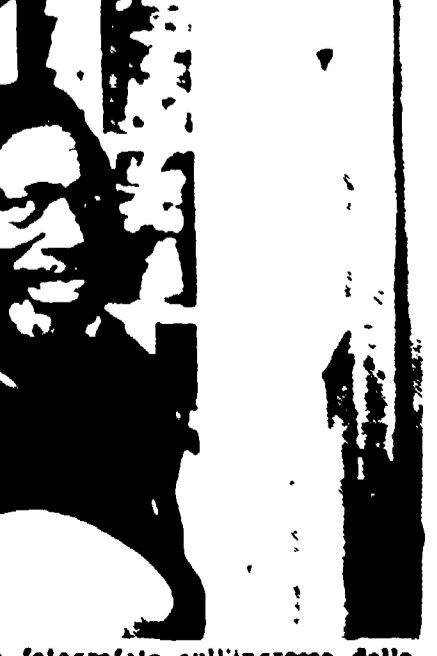
NAIROBI - Jomo Kenyatta fotografato sull'ingresso della sua abitazione mentre saluta la folla (Telefoto)