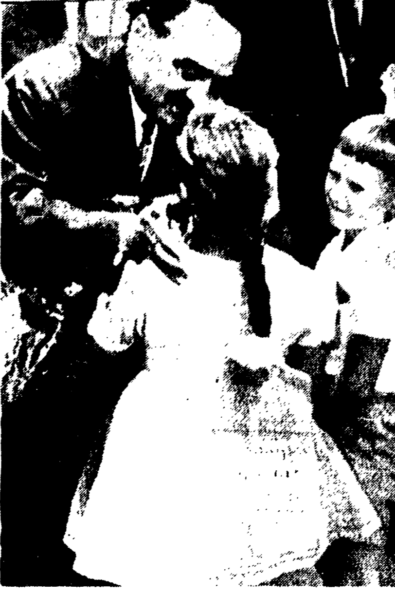
TOKYO — Mikoian riceve un omaggio floreale al suo arrivo all'aeroporto