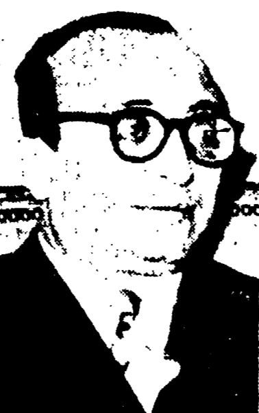
Salah Ben Youssef

Il leader tunisino già condannato a morte da Burghiba per « complotto » fu segretario del « Neo Destour »