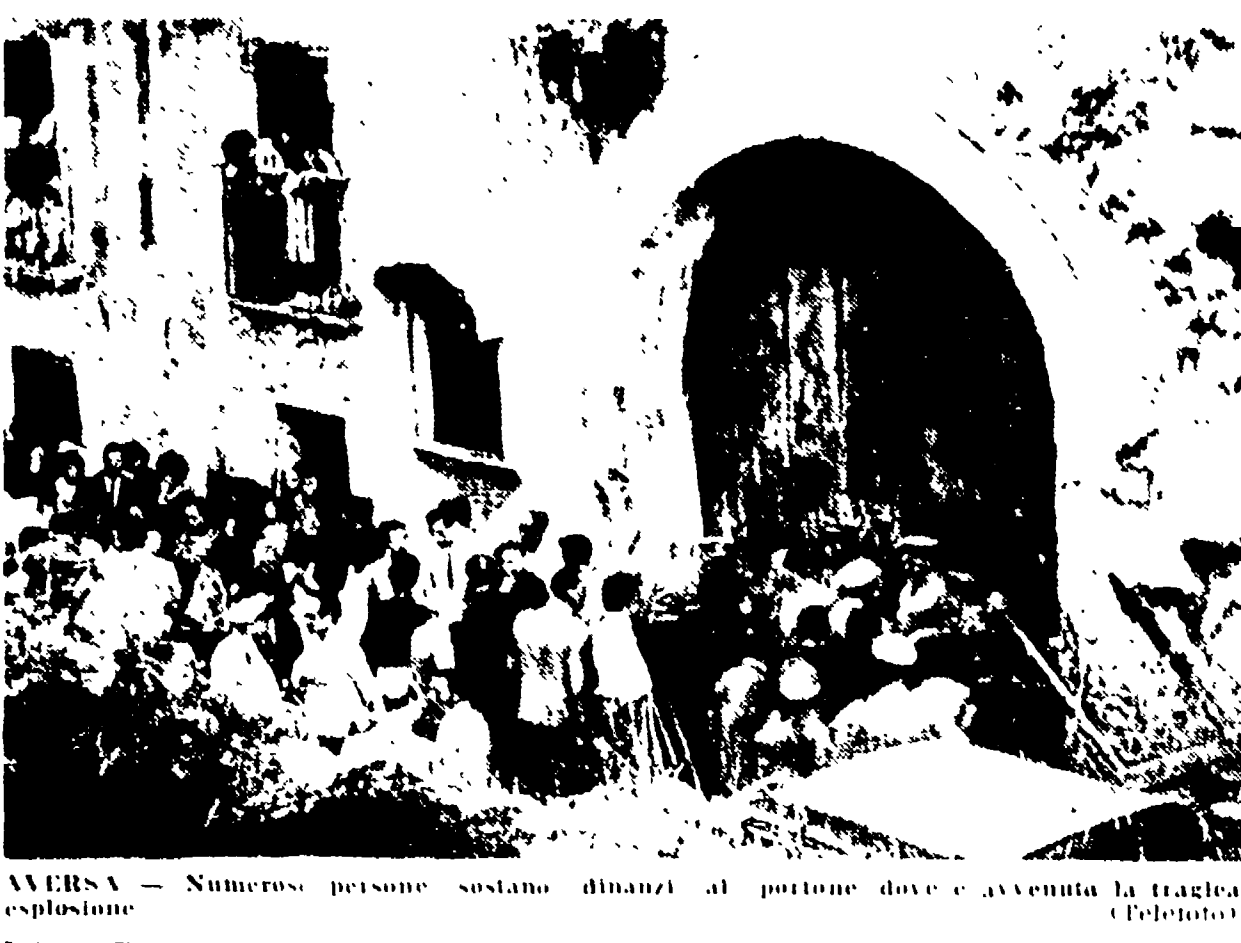
AVVERSA - Numerose persone sostano dinanzi al portone dove è avvenuta la tragica esplosione.

Sette sono le vittime di sciagure balneari che si sono verificate in questi giorni lungo le coste della Romagna. Le vittime sono state: un bambino di 12 anni, un bambino di 10 anni, un bambino di 8 anni, un bambino di 6 anni, un bambino di 4 anni, un bambino di 2 anni, e un bambino di 1 anno. Le sciagure sono state causate da diverse cause, tra cui l'incendio di un baraccone, l'affondamento di una barca, e l'incendio di un campo di canovaccio.