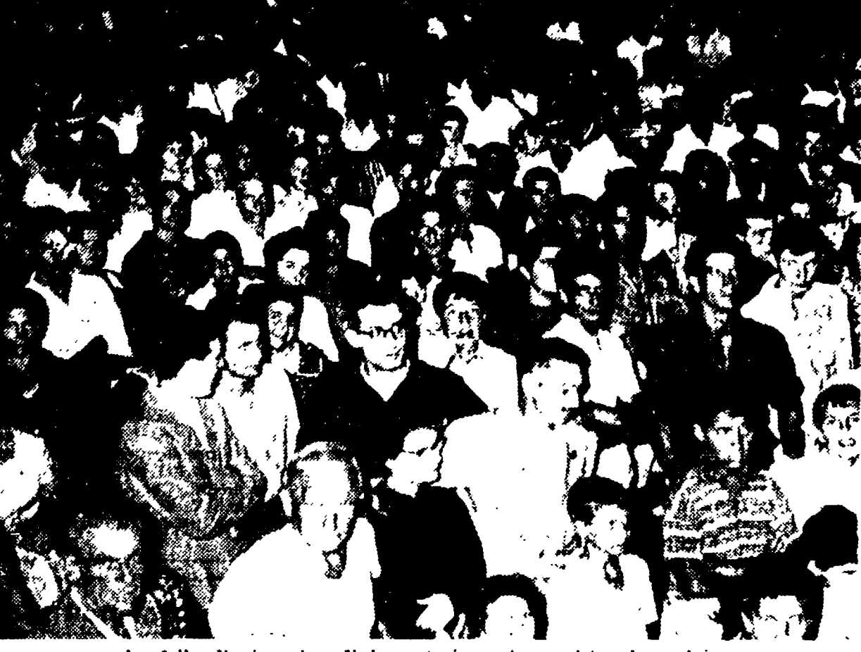
La folla di giovani e di lavoratori mentre assiste al comizio