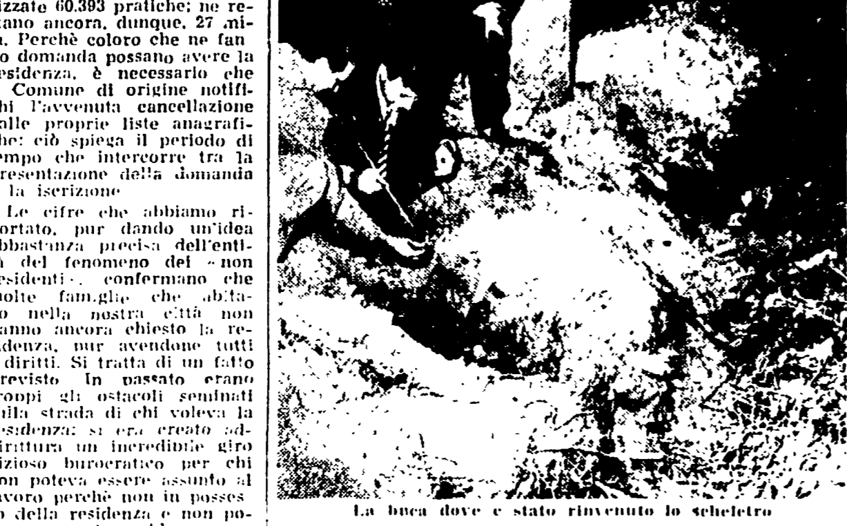
La buca dove è stato rinvenuto lo scheletro

La macabra scoperta fatta da alcuni operai — Si tratta di un delitto?