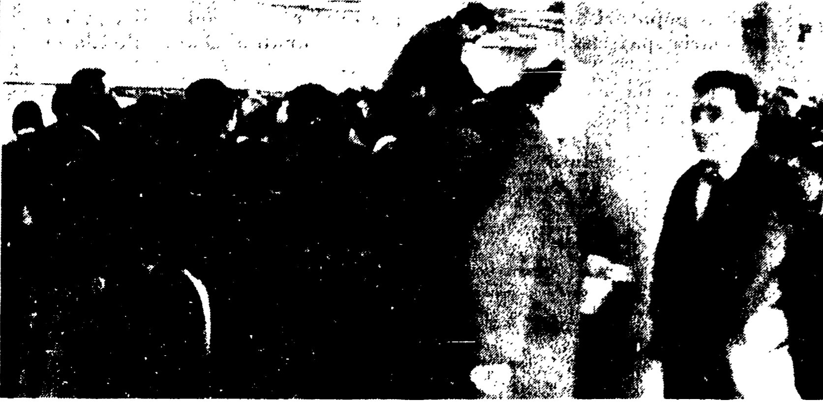
Le « code » all'Anagrafe subito dopo la promulgazione della legge sulla residenza

Urgente il problema della iscrizione nelle liste elettorali - Passo del PCI presso il Comune