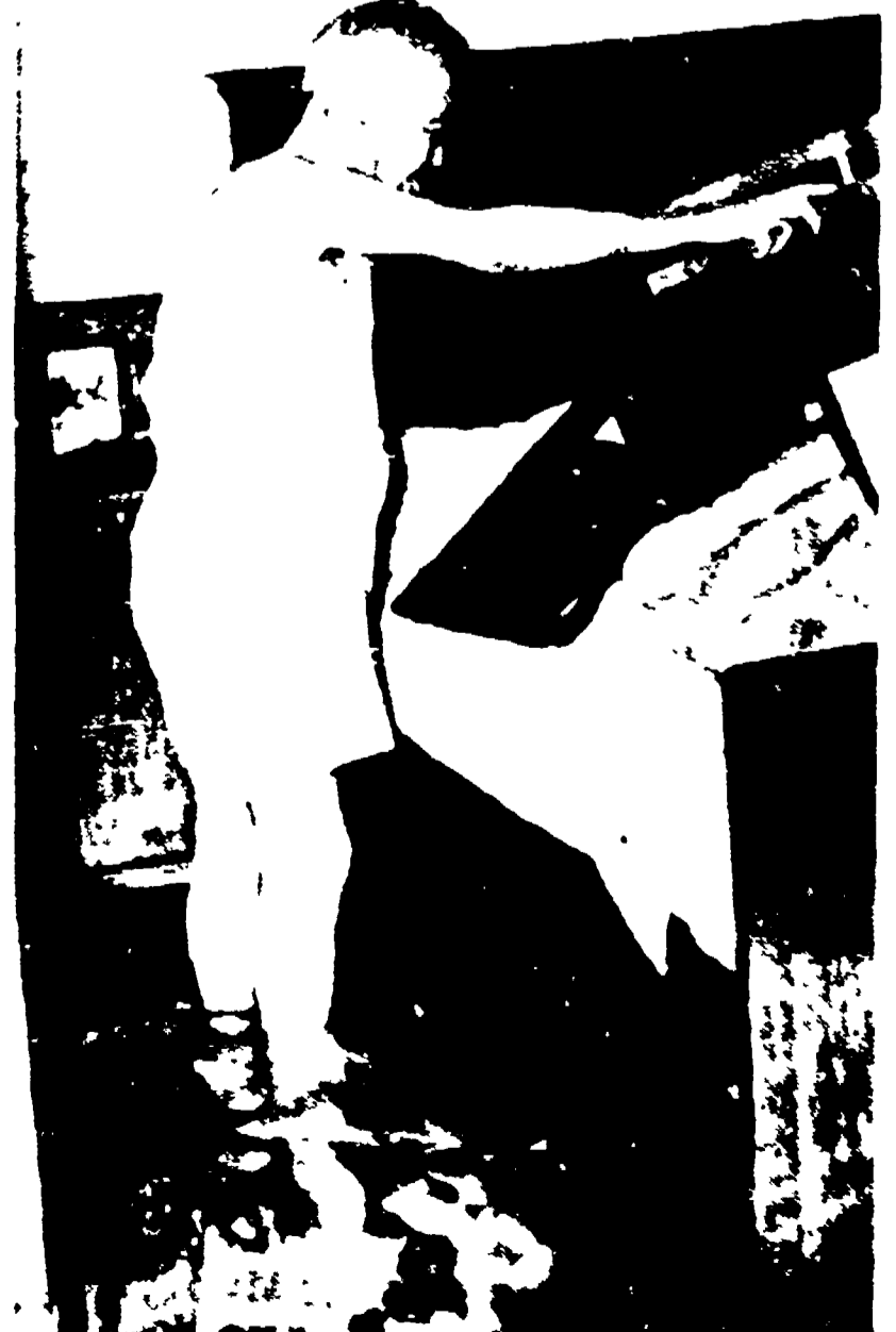
Un tubo dell'acquedotto è scoppiato, allagando piazza San Gallo a Firenze

Nessuna ricerca fatta a Milano dei Cézanne rubati. Nessuna ricerca è stata fatta a Milano per i dipinti di Cézanne rubati.