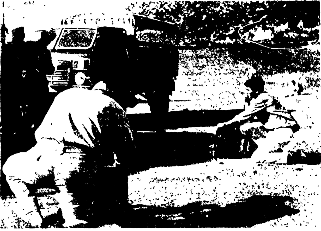
Alcuni membri della spedizione si tengono in contatto attraverso il radiotelefono con gli speleologi penetrati nella fossa