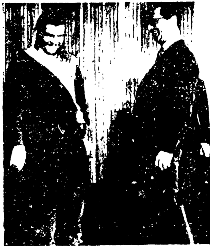
BRASILE. Il presidente Juscelino Kubitschek, dimissionario, con la moglie. A fianco: il vicepresidente João Goulart.

L'esercito respinge le dimissioni — Si organizzano manifestazioni al grido "Janio si, Lacerda no" — Un messaggio alla Nazione — La politica estera di neutralismo al centro delle accuse degli avversari — Goulart rientra in volo dalla Cina