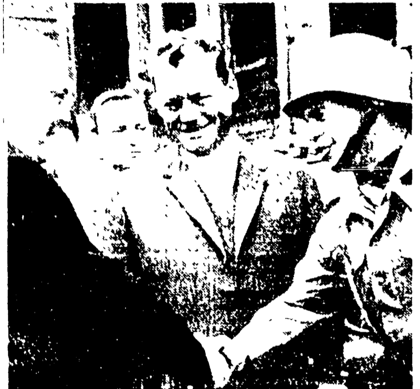
BERLINO — Dame Adenauer con il figlio (a sinistra) e il marito (a destra). Nella foto: l'ambasciatore americano a Berlino, John J. McCloy, con la moglie e il figlio. A sinistra: il ministro degli Esteri, Gromyko.

Il clima politico in Germania occidentale è tutt'altro che democratico. La vedova di un generale nazista vive dieci volte meglio della vedova dell'attentatore di Hitler. Quando Adenauer va a pranzo il Consiglio dei ministri finisce di lavorare. Anche i vecchi liberali tornano in emigrazione.