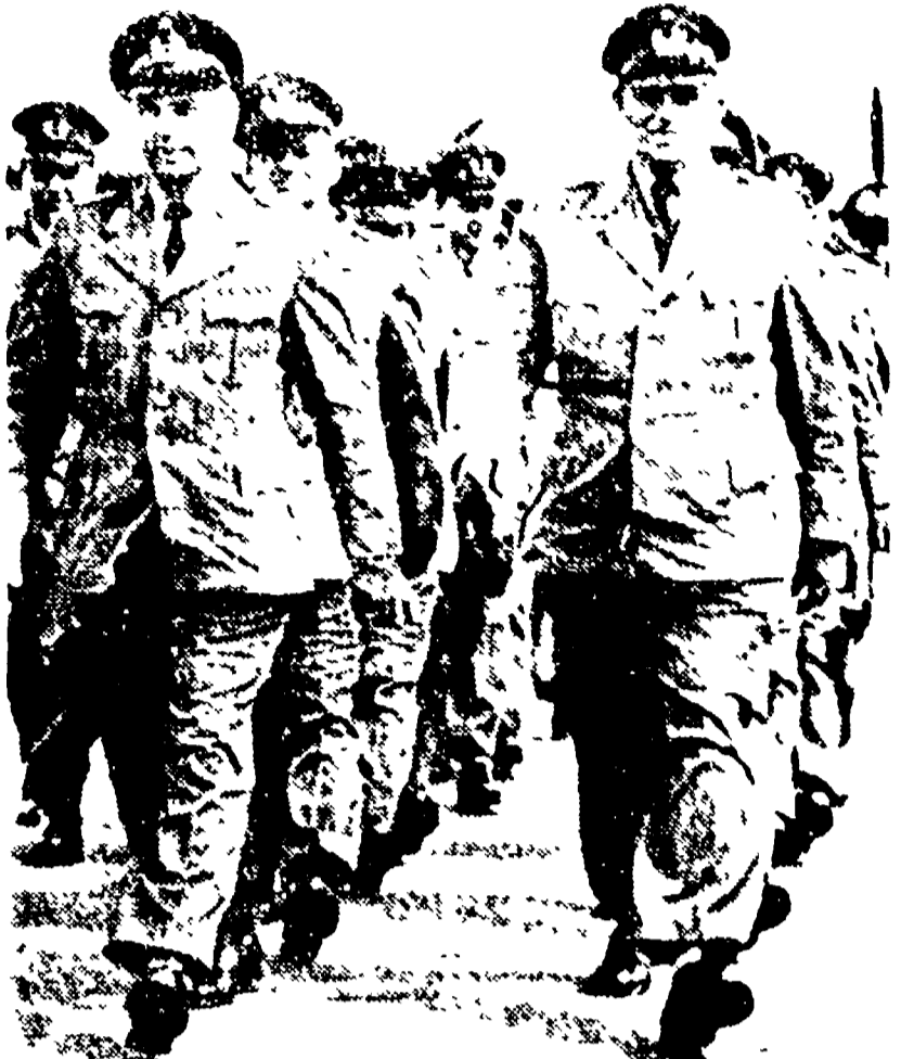
LONDRA — Gli alleati tedeschi fotografati al loro arrivo in Inghilterra mentre l'Espresso