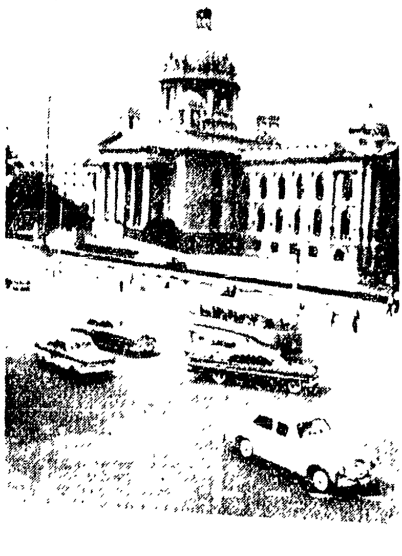
BELGRADO. — Una veduta esterna del palazzo del Parlamento federale di Belgrado dove si riuniranno i capi dei paesi non impegnati.

La conferenza dei paesi non impegnati dopo un mese e più di lavoro preparatorio, si aprirà il 1° settembre a Belgrado. Saranno rappresentati 21 paesi: 10 presidenti di repubblica, 1 monarca, 8 capi di governo. I temi della conferenza: Berlino, Biserta, colonialismo, basi militari. La conferenza dei paesi non impegnati dopo un mese e più di lavoro preparatorio, si aprirà il 1° settembre a Belgrado. Saranno rappresentati 21 paesi: 10 presidenti di repubblica, 1 monarca, 8 capi di governo. I temi della conferenza: Berlino, Biserta, colonialismo, basi militari.