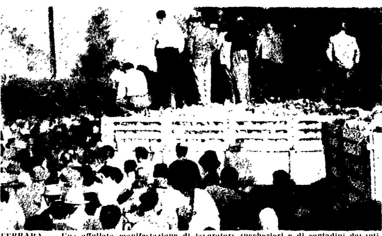
FERRARA - Una affollata manifestazione di lavoratori zaccarifieri e di contadini davanti allo stabilimento di San Biagio d'Argenta.

Quanto alle trattative, le discussioni svoltesi ieri mattina e ieri sera non hanno portato a nessun cambiamento della posizione degli industriali.