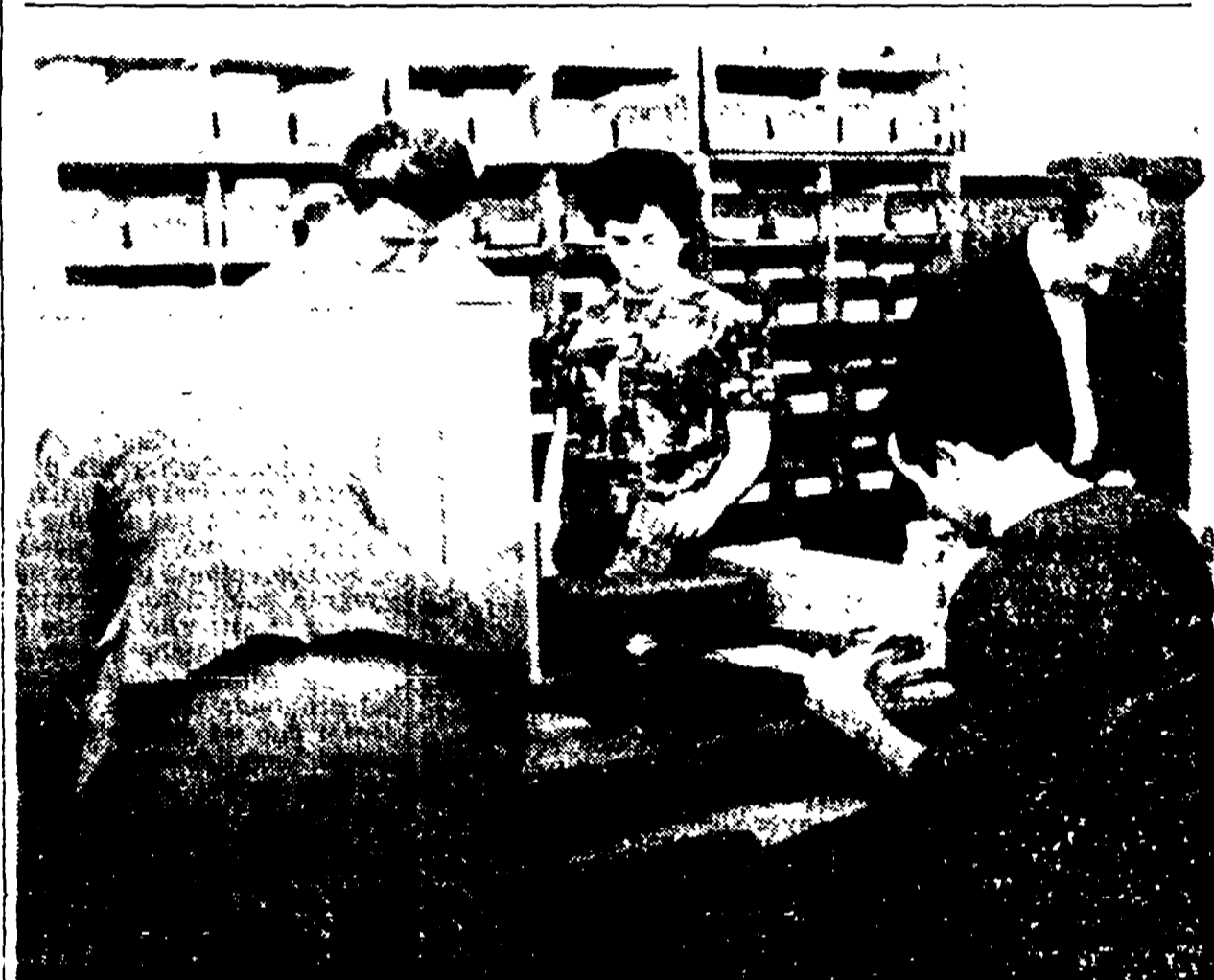
FRANCOFORTE. — Sono cominciate le elezioni generali infatti gli aventi diritto al voto che non possono recarsi alle urne domattina, provano a votare per il più vicino ufficio elettorale. Nella telefoto un votante in piedi (di spalle) mentre profeta da un pannello (per rispettare la segretezza del voto) si appresta a votare. Seduto a destra un altro elettore in attesa di compiere la stessa operazione dinanzi agli impiegati dell'ufficio elettorale che siedono dietro il tavolo. La scheda, una volta riempita verrà chiusa in busta e consegnata all'ufficio elettorale o inviata per posta alla propria circoscrizione.