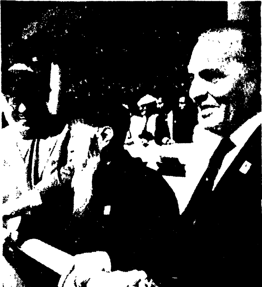
Carlos Prestes fotografato insieme a Ho Chi Min e Li Guisi a Pechino in occasione della festa della Repubblica cinese nel 1959

I comunisti hanno appoggiato la lotta di Goulart - Gli USA non possono più realizzare tutti i loro disegni nel Continente - La lotta per il consolidamento della democrazia