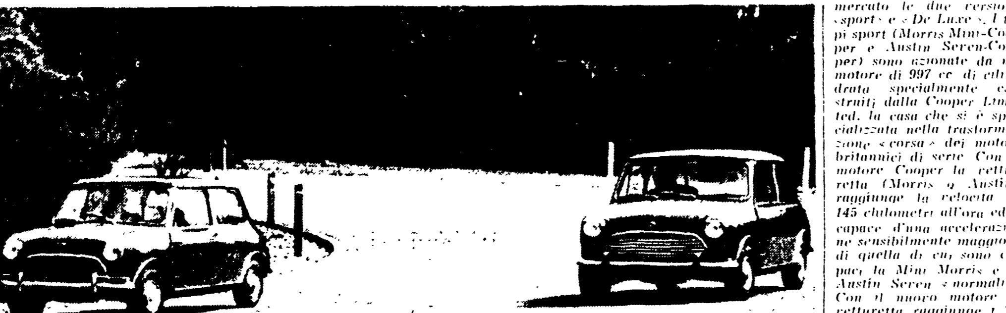
LONDRA - La settecento Austin Cooper (a sinistra) e la Morris Mini-Minor. Le due macchine superano a velocità sostenuta una curva del circuito di prova.

Un liquido speciale per raffreddare il motore della nuova Renault R. 4 - Migliorata l'utilitaria della D.K.W. - La FIAT presenta le due versioni della 2300 coupé