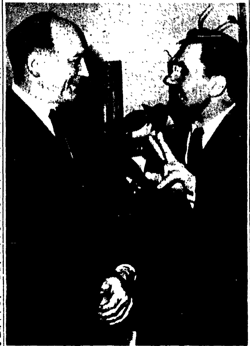
NEW YORK — Gromiko e Rusk ritratti al termine del loro colloquio