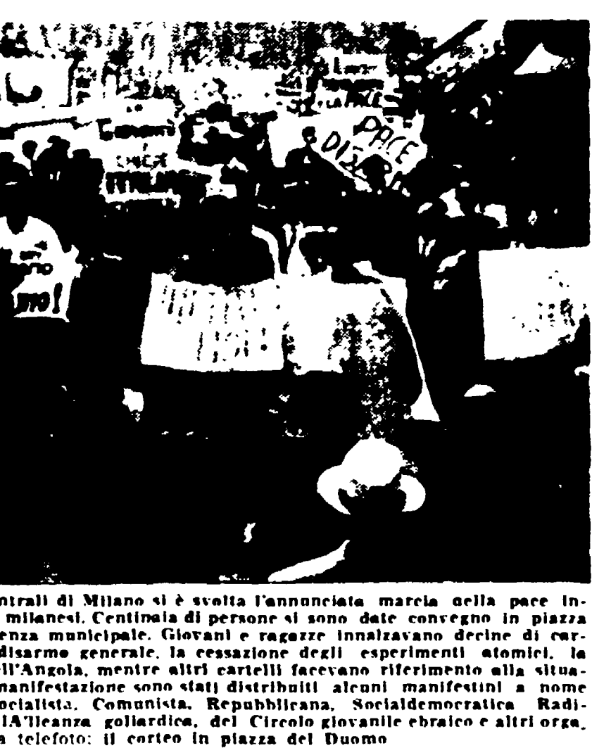
MILANO - Ieri per le vie centrali di Milano si è svolta l'annunciata marcia della pace...

Un contrasto leale e franco. Unità nella multiformità, nella diversità; unità periferica nel contrasto leale e franco dei principi e dei programmi politici.