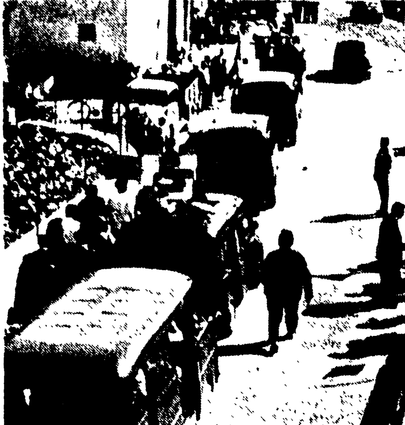
PERUGIA - La polizia fiancheggiata la «marcia della pace»