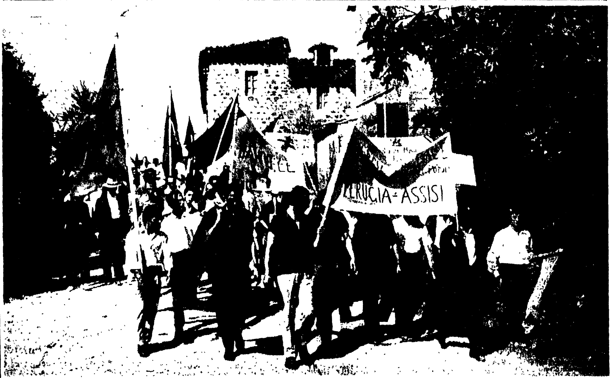
PERUGIA - Un aspetto dell'imponente corteo; si riconoscono (in primo piano, da sinistra), gli scrittori Giovanni Arpino, Pio Balducci e Italo Calvino