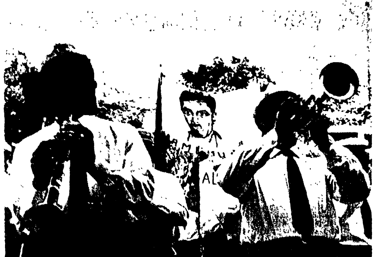
PERUGIA - Si marcia verso Assisi al suono delle bande