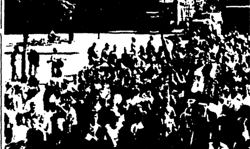
DAMASCO - La folla manifesta a Damasco. Soldati armati montano la guardia nell'edificio della radio. Nello sfondo autobluinde e camion dell'esercito siriano (Teletipo)

(Continuazione dalla 1. pagina) In seguito alle manifestazioni ostili al nuovo regime verificatesi a Damasco e ad Aleppo, la giunta fino a un certo punto unitaria, come pure di tutte le scuole statali e private, l'esercito ha inoltre vietato a tutti i civili il possesso di armi. Un comunicato ordinava che tutti i civili consegnino le loro armi alla polizia.