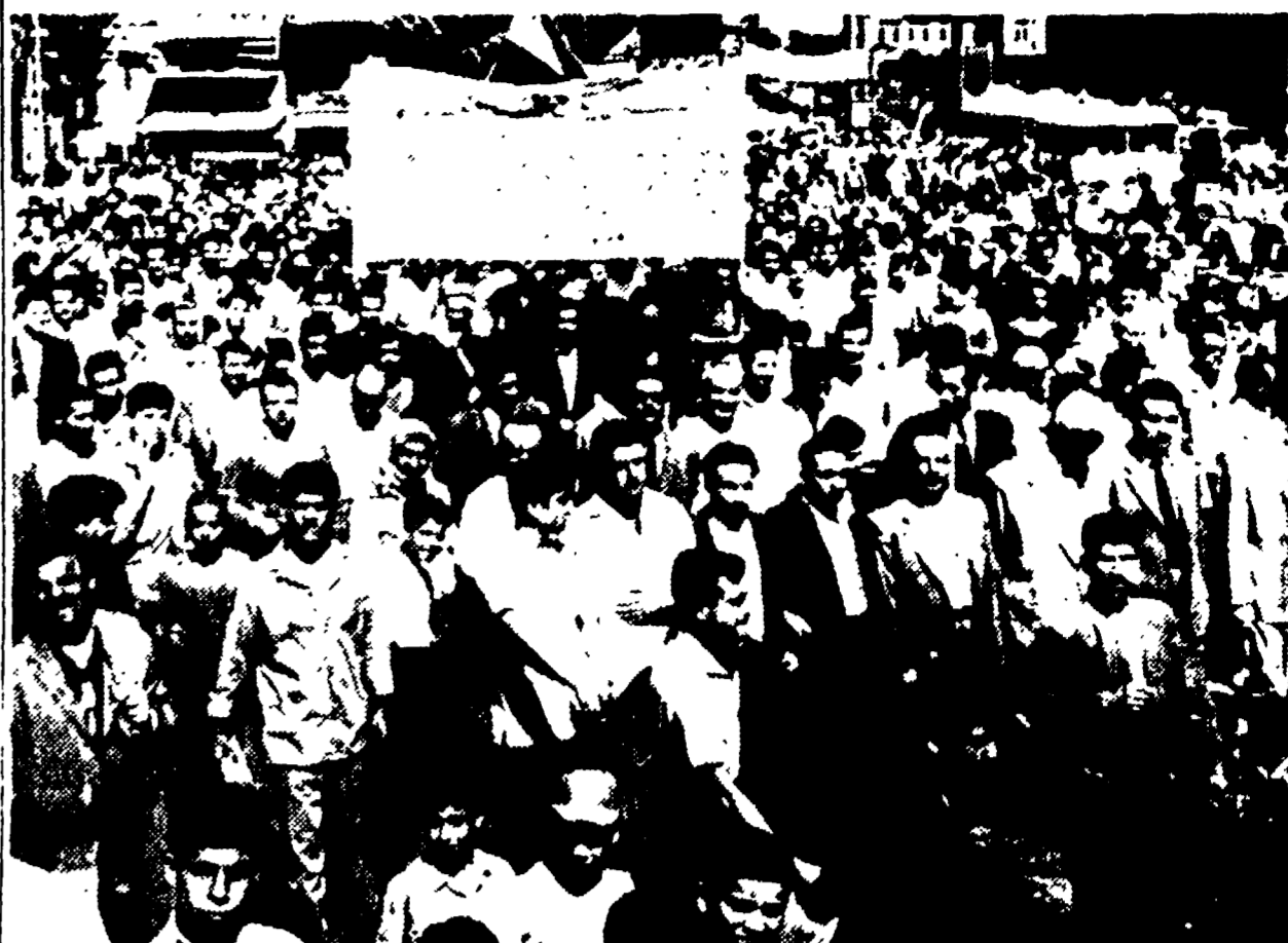
DAMASCO - Ufficiali dell'esercito siriano, messi in congedo dopo l'unione del loro paese con l'Egitto, manifestano con cartelli in cui è scritto: « I militari illegittimamente disarmati pongono a disposizione dell'alto comando della rivoluzione araba » (Teletipo)

(Continuazione dalla 1. pagina) In seguito alle manifestazioni ostili al nuovo regime verificatesi a Damasco e ad Aleppo, la giunta fino a un certo punto unitaria, come pure di tutte le scuole statali e private, l'esercito ha inoltre vietato a tutti i civili il possesso di armi. Un comunicato ordinava che tutti i civili consegnino le loro armi alla polizia.