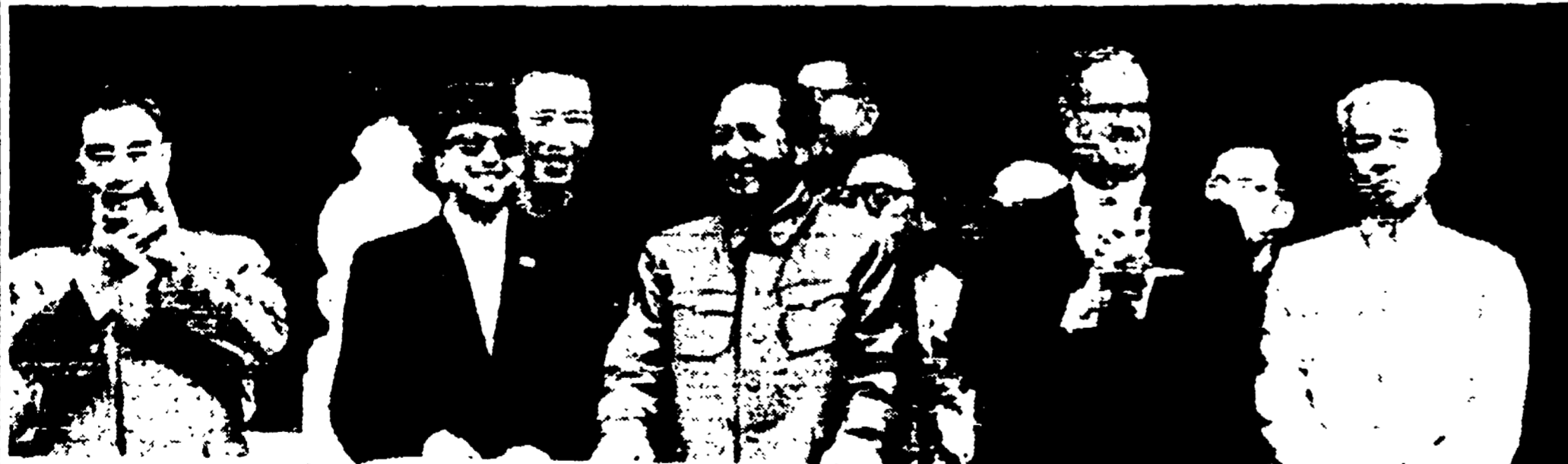
PECHINO - Ciu En-lai (da sinistra), il re del Nepal Mahendra, Mao Tse-tung, il presidente cubano Dorticos e Liu Sciao ci, presidente della R.P. cinese, mentre assistono alla parata per il 12. anniversario della grande rivoluzione cinese

PECHINO, 1. - Oltre 500.000 lavoratori, contadini, giovani, soldati, artisti ed atleti hanno sfilato oggi per le strade di Pechino per celebrare il 12. anniversario della Repubblica popolare cinese.