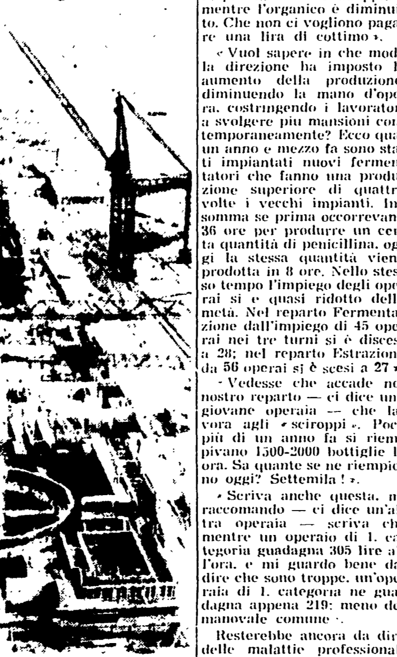
DUNGENESS - La telefoto mostra una visione del cantiere dove si sta costruendo una nuova centrale atomica per la produzione di energia elettrica.

In corso la revisione di tutti i veicoli immatricolati prima del '51