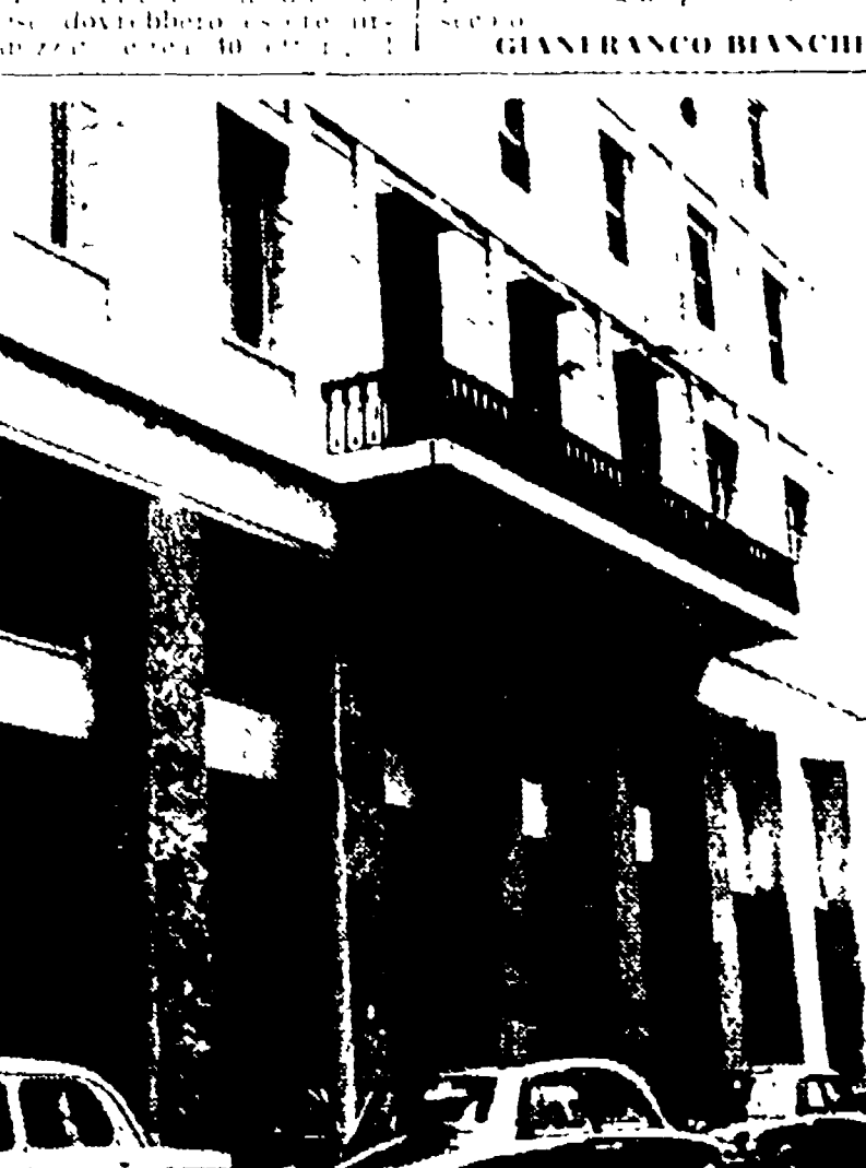
La Sede della «Metroroma» in via Sicilia, una delle società che partecipano al concorso-appalto del nuovo tronco di metropolitana in questa sottile conversione, la Terziaria Roma-Nord la SICI e la Edison.

A Roma si aggiunge una nuova e Lucca. Intanto, la città continua nel suo processo di espansione. Si è già costruito il nuovo tronco di metrò che unisce il Flaminio a Tuscolano, attraverso il centro storico.